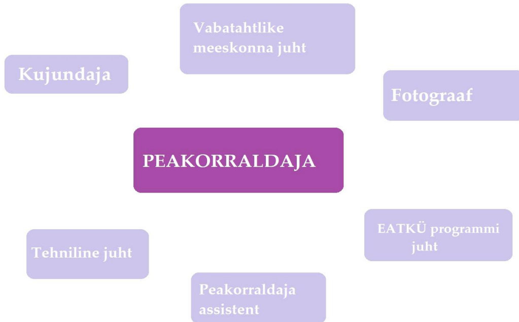
Joonis 1: Koerapäev 2021 korraldusmeeskond

Peakorraldaja ülesanneteks olid ürituse kontseptsiooni paikapane, meeskonna moodustamine, eelarve ja tegevusplaanide koostamine, koostööpartnerite ja osalejate leidmine, lubade ja taotluste koostamine ja edastamine ning kommunikatsioon kõigi seotud osapoolte vahel. Samuti oli peakorraldaja vastutuseks kogu sündmuse sujuv toimumine, kõigi osapoolte ülene kommunikatsioon ning tekkinud probleemide lahendamine.