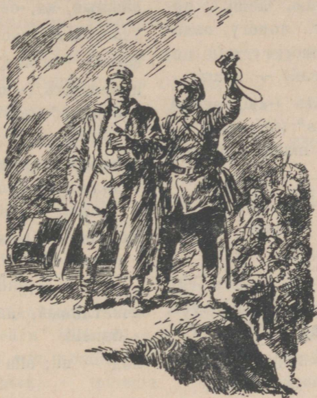
Сталин и Ворошилов на фронте под Царицыным.

старый порядок, снова получить землю и фабрики. В этой войне Сталин был на самых важных участках фронта. Красная Армия победила врага.