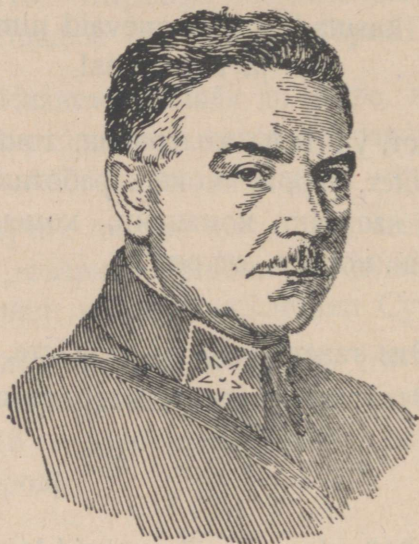
Климент Ефремович Ворошилов.