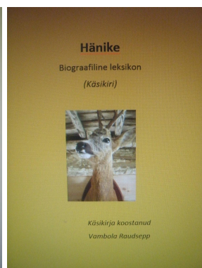
Hänike. Biograafiline leksikon