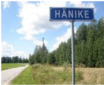
Hänike küla viit