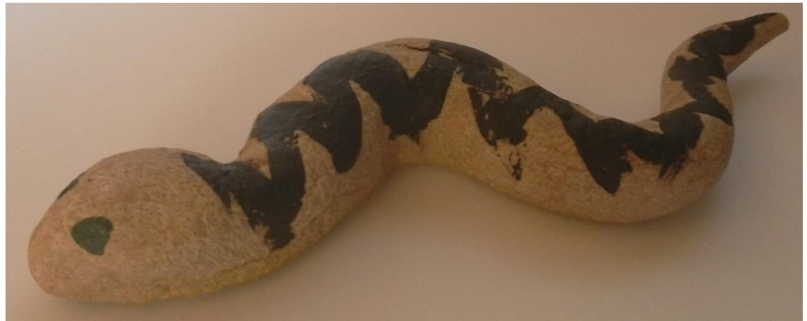
Joonis 2. Siksakmustriga uss. Kolmeaastase lapse töö.