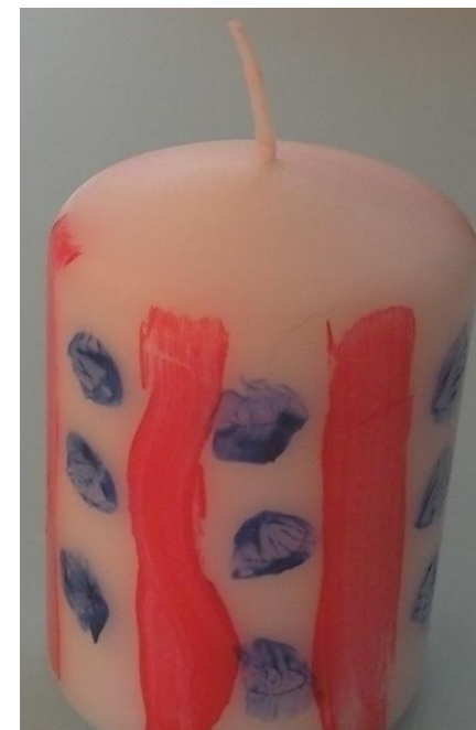
Joonis 3. Adventiküünal. Kolmeaastase lapse töö.