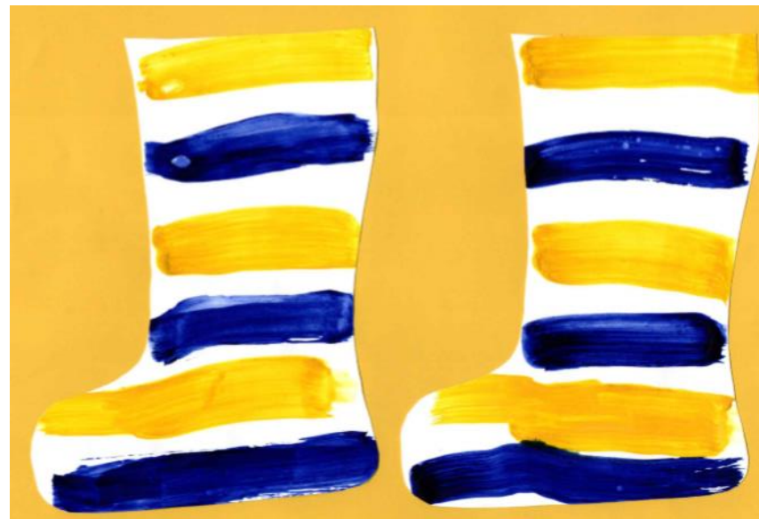
Joonis 1. Triibulised kummikud. Kolmeaastase lapse töö.