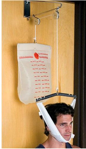
Joonis 3. Over-the-Door traktsioon ( https://www.isokineticsinc.com/product/cg_4390 ).