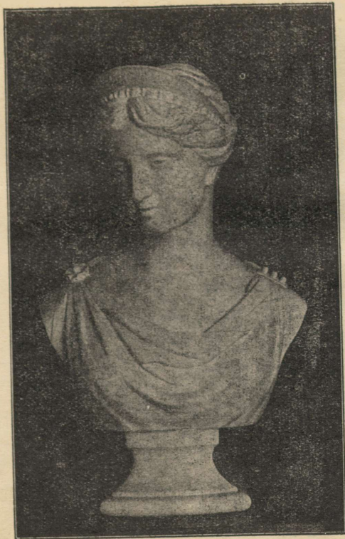
A. Weizen- berg: