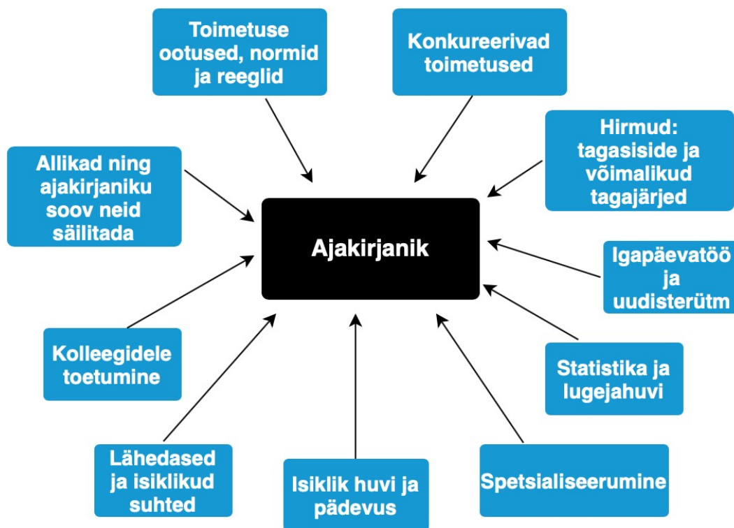
Joonis 2. Ajakirjanike tajutud uudisväärtuslike lugude ilmumata jätmise tegurid

Tulemusi arvesse võttes lõin järgneva joonise: