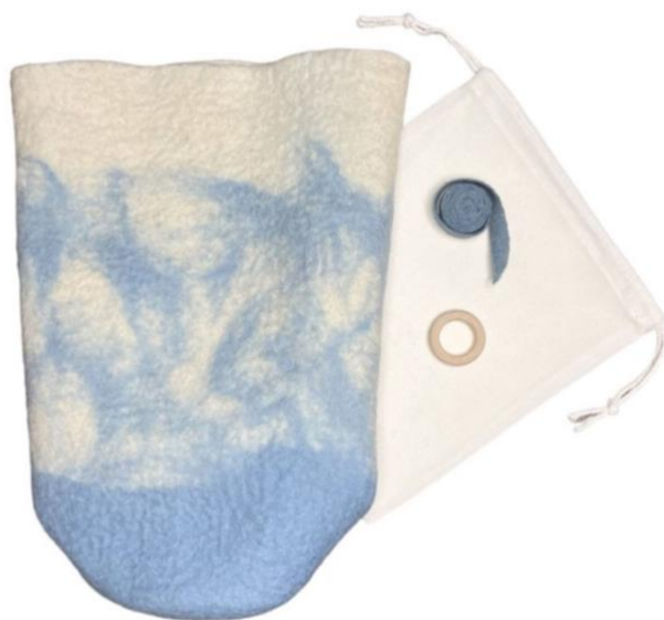
Joonis 9 sukakujuline vildist urn (Eco Urn Shop, s.a.)

Hollandi firma Eco Urn Shop pakub oma veebipoes vilditud ja ka tugevamast taaskasutusmaterjalist urne. Vilditud urnid on suka kujulised (vt. Joonis 9) ning nende sulgemiseks on komplekti lisatud puuvillane nöör. Komplektis on ka puuvillane kott tuha jaoks. (Eco Urn Shop, s.a.)