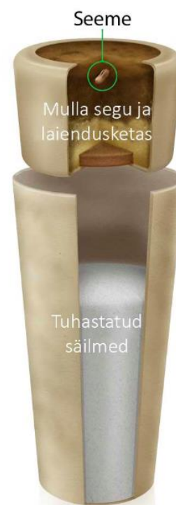
Joonis 4 urn puumatuseks (Bios OÜ, s.a.)

Urn.ee pakub mitme erineva tootja urne ning ka valikut biolagunevaid urne. Urnideks kasutatavad materjalid on lainepapp, puit, tselluloos ja plastikualternatiiv Sulapac. Selle firma soov on pakkuda võimalikult mitmekesisist tootevalikut. (Urn.ee, s.a.)