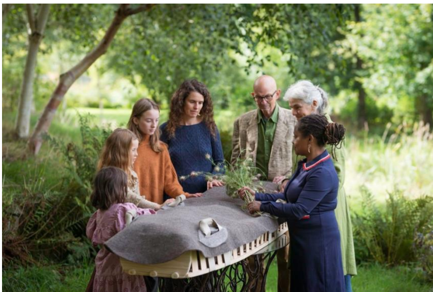
Joonis 1 hällikujuline kirst villase kirstukattega (Bellacouche, s.a.)

Tänapäeval aga on välja mõeldud alternatiivseid keskkonnasõbralikke lahendusi kirstumatusel. Inglismaa firma Bellacouche valmistab erinevaid ökoloogilisi tavanditarvikuid. Tootevalikus on neil olemas puidust hällikujulised kirstud (vt. Joonis 1), mida on võimalik tellida nii täiskasvanu- kui ka