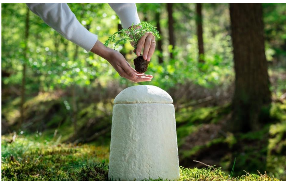
Joonis 6 seeneniidistikuga urn (Loop, s.a. )

Märkimisväärne urni on välja töötanud Hollandi firma Loop. Selle tehnoloogia väljaarendamist alustasid kaks tudengit Delfti tehnikaülikoolis oma lõputöö raames. Tänapäevaks on sellest projektist neil välja kasvanud firma Loop, mis pakub seeneniidistikuga urne. Urni maha mattes aitavad seeneniidistikud kaasa lagunemisprotsessile. Seeneniidistikuga tooteid kasvatavad nad oma laboris ning need on 100% biolagunevad. (Loop, s.a. )