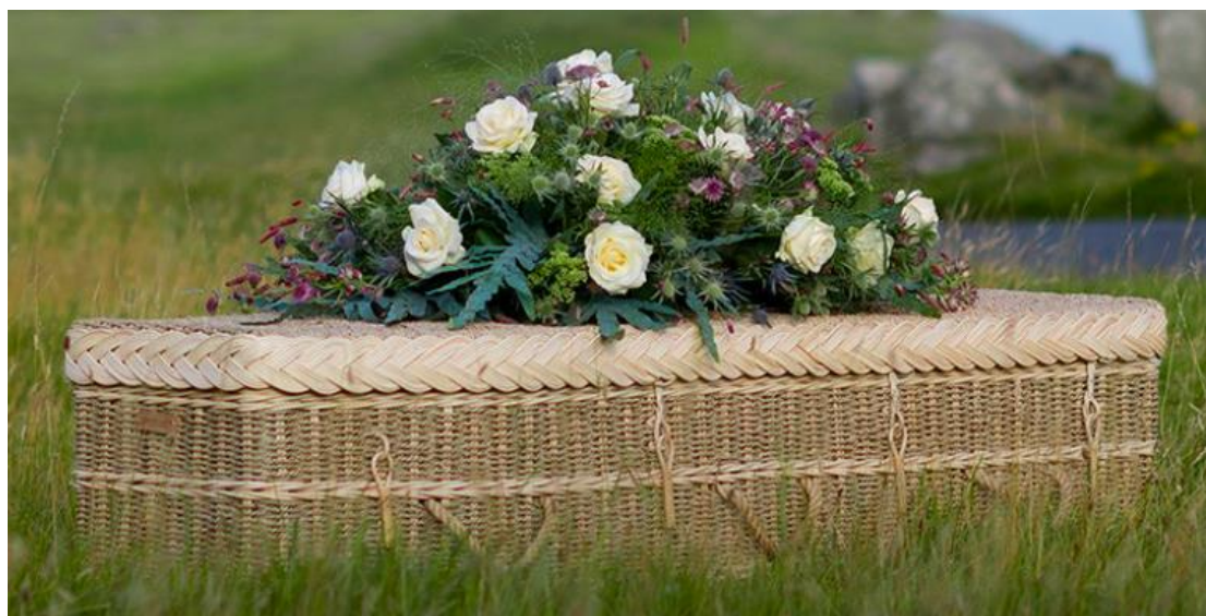
Joonis 2 punutud kirst (Natural Woven Coffins, s.a.)

Erinevad välismaised firmad, eelkõige Inglismaa firmad, on hakanud tootma ja müüma ka punutud kirste. Firma Natural Woven Coffins pakub nii ümarama kui ka traditsioonilisema kujuga kirste (vt. Joonis 2). Materjale, mille vahel valida, on kuus: merihein, roo-materjal, paju (ka värvitud kujul), banaanileht, oksad ja bambus. (Natural Woven Coffins, s.a.)