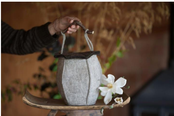
Joonis 7 mooniseemne kujuline vildist urn (Bellacouche, s.a.)

Tekstiilsetest materjalidest on kasutatud urnide puhul palju vilti. Bellacouche pakub ka viltmaterjalist urne. Urn on disainitud mooniseemne järgi (vt. Joonis 7) ning selle sees on tuha jaoks eraldi puuvillane kott. Urnile on lisatud nöör ja puidust käepide, mille abil saab selle lugupidavalt hauda langetada. (Bellacouche, s.a.)