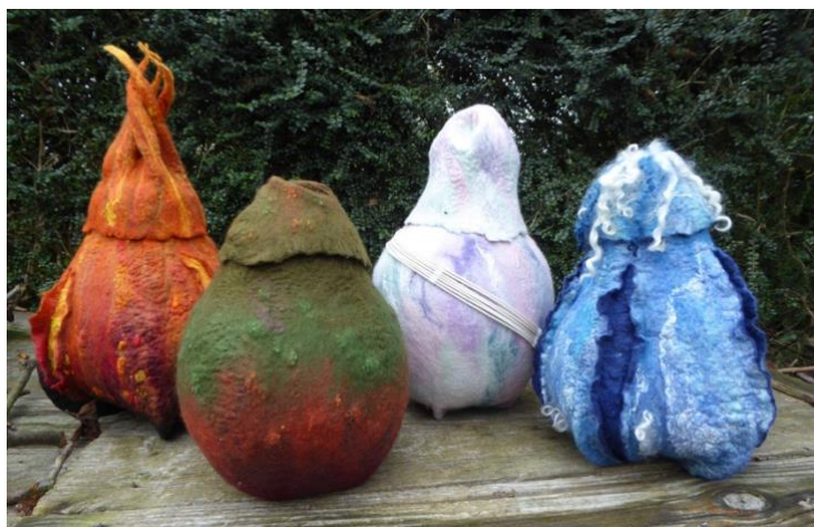
Joonis 8 looduselementidest inspireeritud urnid (Well Urned Rest, s.a.)

Omanäolisemaid lahendusi pakub Inglismaa tekstiilidisainer, kes ammutab inspiratsiooni looduselementidest (vt. Joonis 8). Valiku oma töödest toob ta ka oma firma veebilehel Well Urned Rest välja, kuid rõhutab, et iga toodet on võimalik teha ka vastavalt erisoovidele. (Well Urned Rest, s.a.)