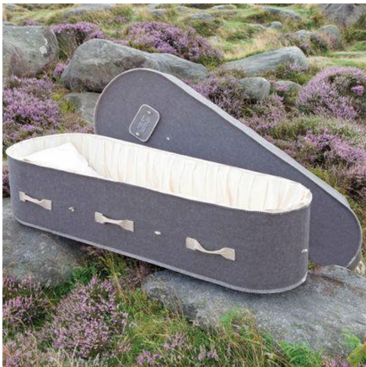
Joonis 3 villane kirst (Natural Endings, s.a.)

Yorkshire linnas asuv matusebüroo Natural Endings pakub samuti looduslähedasi alternatiive kirstumatuseks. Lisaks papist ja punatud kirstudele pakuvad nad ka villaseid kirste (vt. Joonis 3). Nende kirstude puhul on kasutatud villavilti. Kirst on seest tugevdatud papist sisuga ning vooderdatud puuvillaga. Kirstule tikitakse peale silt kadunukese nimega. (Natural Endings, s.a.)