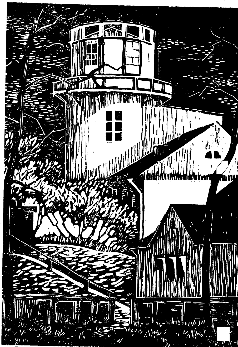
Tartu tähetorn. Linoollõige.