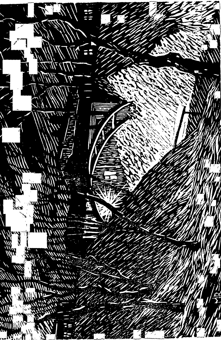
Sild Toomet. Linoollõige.