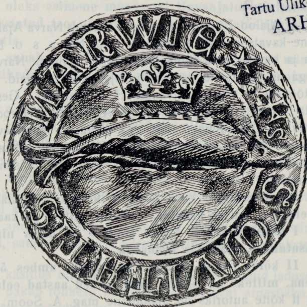
Narva linna vaneim pitsat

NARVA AJALOO SELTS NARVA LINNA ARHIIV, RÜÜTLI TÄN. 28, NARVA