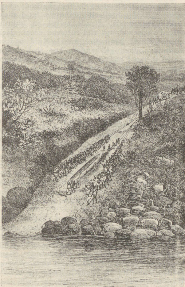
Tee viib üle mägede.