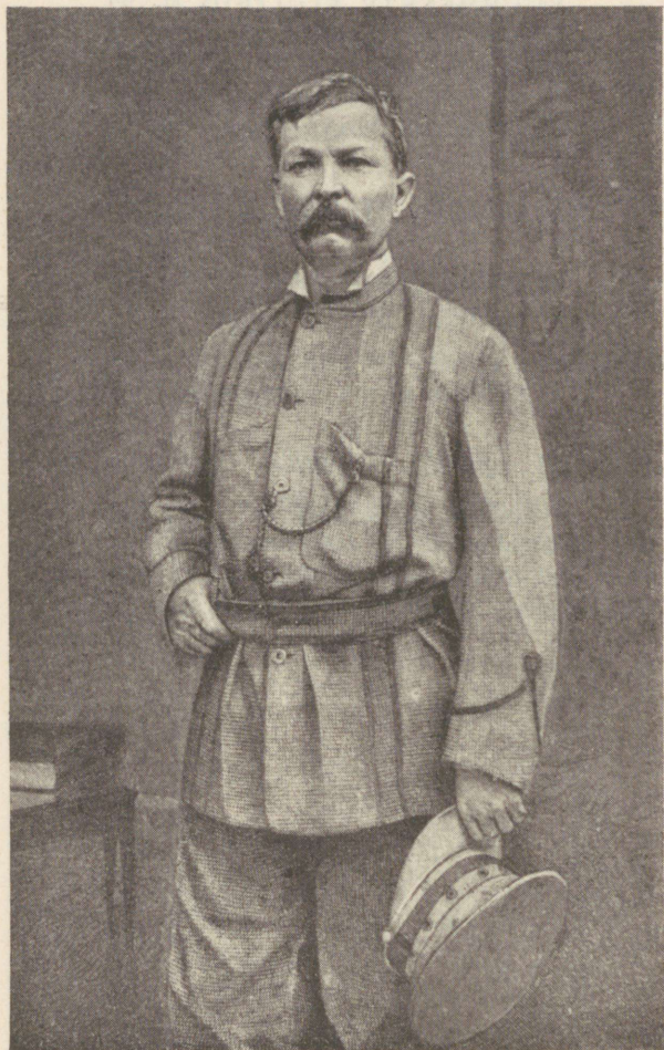
H. M. STANLEY