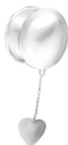
Joonis 4. 16 mm tunnelkõrvarõnga kavand