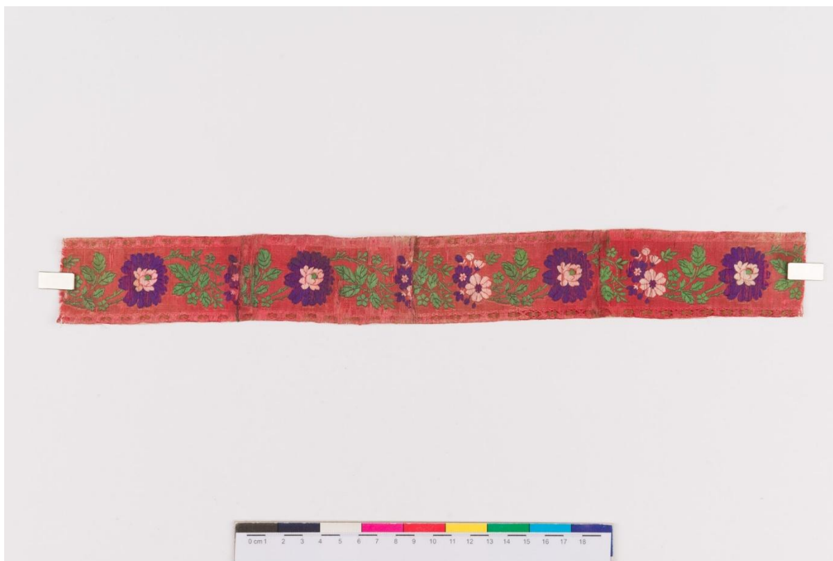
Joonis 7. Kaeluslint (Hargla naise) (ERM A 599:195); Eesti Rahva Muuseum

Läbivaks elemendiks kõigi komplekti kuuluvate ehte juures on Hargla naise rahvarõivaste juurde kuuluvalt siidipaelalt võetud lilleornamentika (vt joonis 7). Siidipael on Hargla naise riietusse jõudnud kaubandusest: siidilinte ei valmistatud kohapeal, vaid need oli importkaup, kuid seda kanti paljude riietuste juures. Hargla naise siidipaela valisin põhjusel, et alles hiljaaegu sain teada, et mu esivanemad on sealt kandist pärit. Nii sümboliseerivad need lilled mulle osa pere ajaloost, mille kohta kahjuks on palju kaduma läinud. Hargla rahvarõivaid vaadates kõnetas see siidipaelal olnud muster mind just kõige rohkem, kuna oma olemuselt on seal siidipaelal olevad lilled ja nende paigutamine harjumuspärasest nii erinevad.