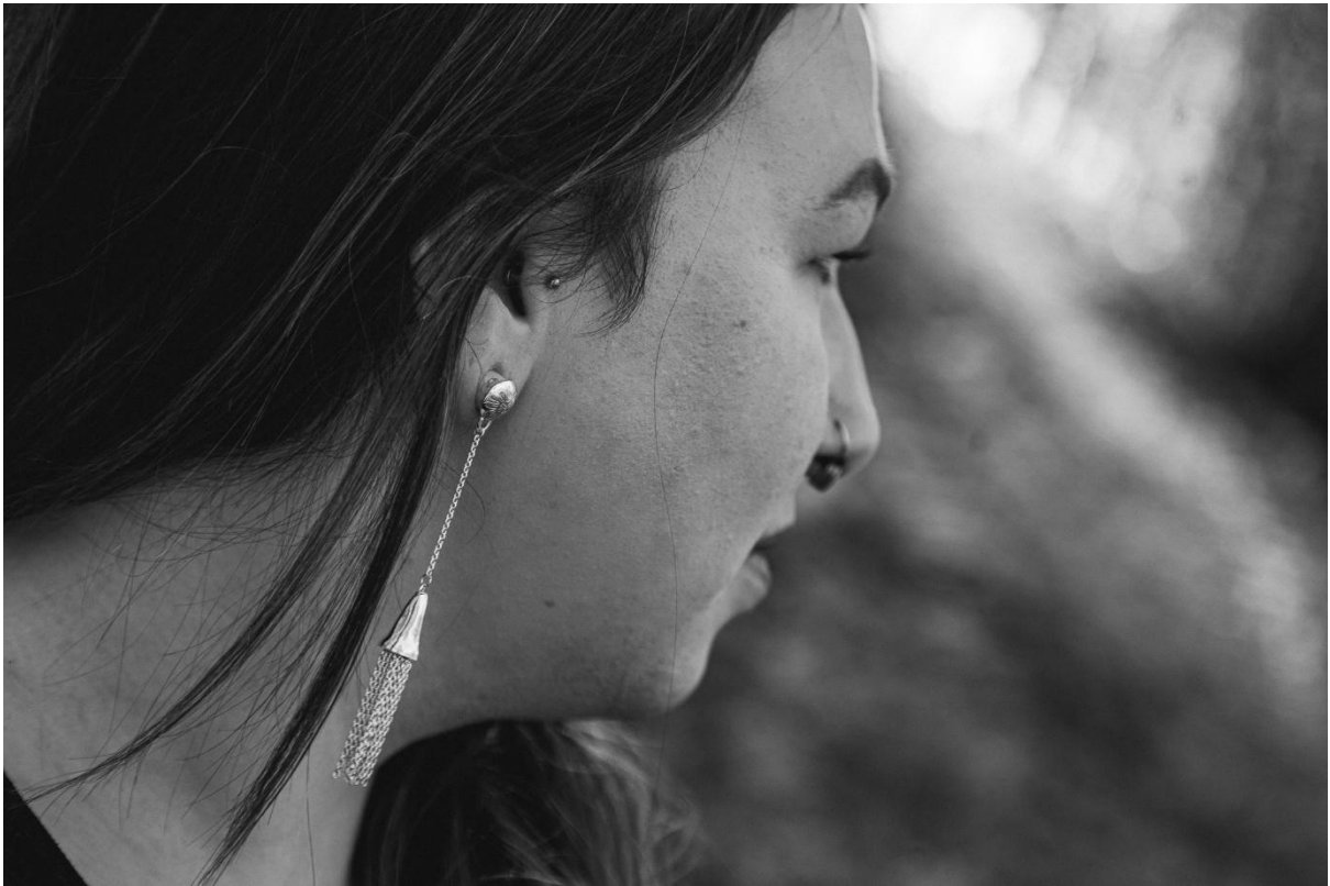
Tuttripatsiga tunnelkõrvarõngas.8mm