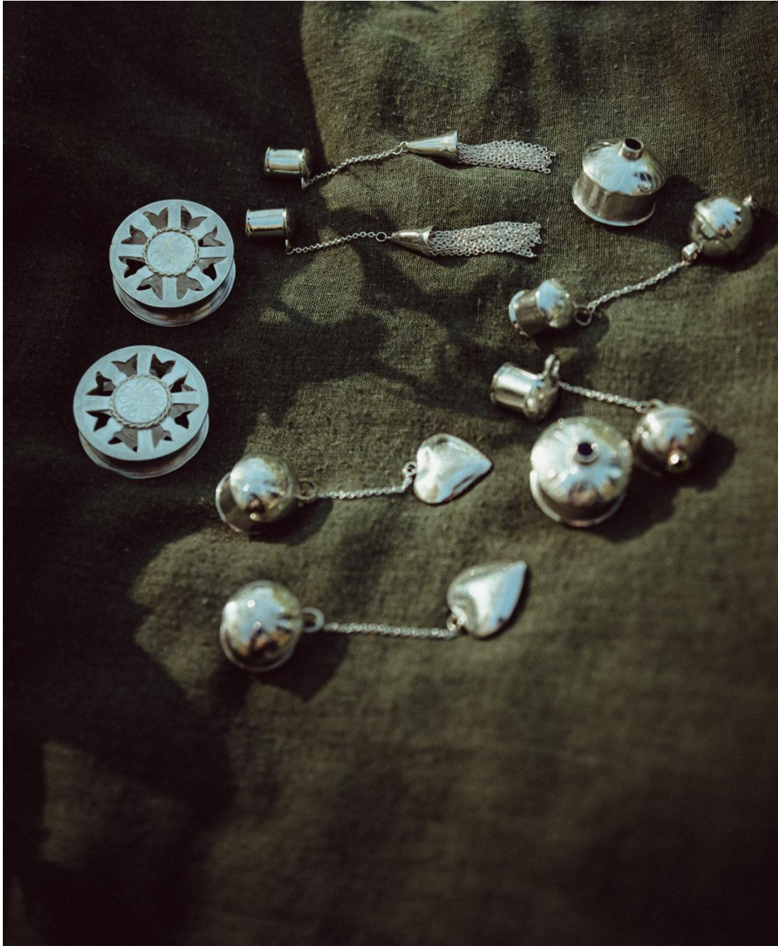
Tunnelkõrvarõngaste komplekt.