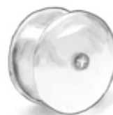
Joonis 5. 20 mm tunnelkõrvarõnga kavand