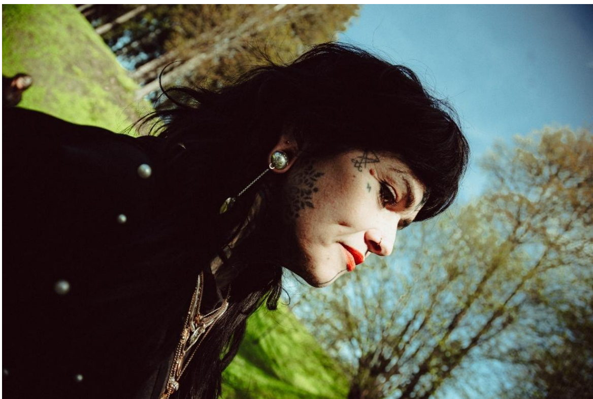
Joonis 13. Südamekujulise ripatsiga tunnelkõrvarõngad.

Viimasel ripatsiga suurusel ehk 16mm diameetriga ehtel on mõlemale tunnelikilbile graveeritud kombineeritud lillemotiiv, mis sobib kokku südamekujulise ripatsiga. Südamekujulise ripatsi valmistamine oli oma protsessilt aeganõudev, kuna õige tehnika ja töövõtete leidmine võttis aega. Algselt valisin enda arvates tugeva kummi, millest nikerdasin välja südame kuju. Tahtsin pressi abil selle kummist kuju tinast vormi lükata, kuid kumm osutus liiga pehmeks. Seetõttu pidin tehnikat vahetama: valisin tugevama kummi, millesse saagisin südamekujulise augu ja kasutasin hoopis seda vormina. 50 kg raskuse pressiga oli võimalik saada 0,5 mm hõbeplekist ilusad südame pooled, mille omavahel kokku jootsin. Südamekujuliste ripatsite ma kive ei lisanud, kuna puhas joon sobis kõrvarõngaga rohkem kokku (vt joonis 13). Selliseid südamekujulisi ripatseid kandsid Seto naised uurikeedi otsas kella asemel.