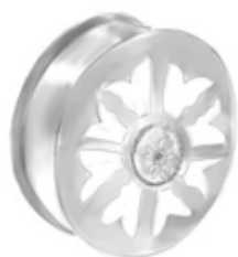
Joonis 6. 30 mm tunnelkõrvarõnga kavand