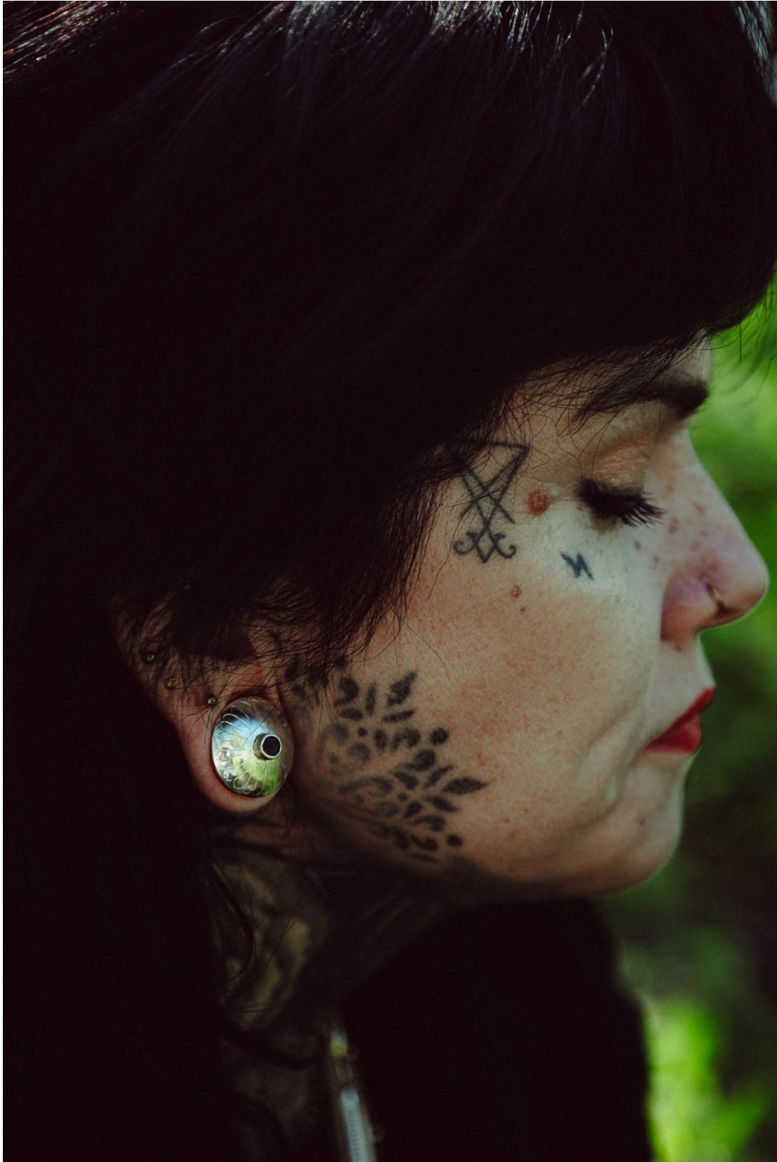
Ametüstiga tunnelkõrvarõngad.