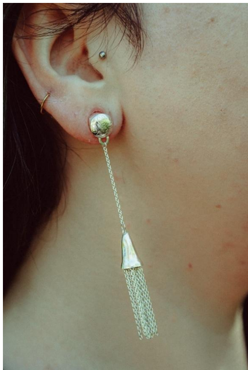
Joonis 11. Tuttripatsiga tunnelkõrvarõngas.

Tuttripatsi valmistamine oli keerulisem, kui algselt arvasin. Koonusekujulise vormi saavutamine ja tuttripatsile iseloomuliku alt kellukakujulise laiendi saavutamine nõudis veidi mõtlemist. Lõpuks sain vajaliku vormi kastikuraua ja anke kuuli abil. Tuttripatsi tuti moodustab peenike kett, algselt valisin liiga peenikeste öösidega keti, mis kahjuks ei sobinud 0,3 mm traadiga. Suuremate öösidega kett aga sobis. Spiraaliks tehtud traadile lükkasin ise valitud pikkuses keti, et tekiks tutt, mille kinnitasin tuttripatsi kellukakujulise osa sisse (vt joonis 11).