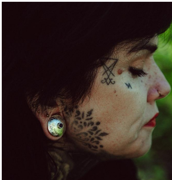
Joonis 14. Ametüstiga tunnelkõrvarõngad.

Kahel viimasel tunnelkõrvarõnga paaril ei ole ripatseid, kuna nende pind on suurem, siis kasutasin seda põhjalikumate graveeringute tegemiseks. 20mm läbimõõduga kõrvrõnga keskel on ametüst ja seda ümbritseb graveering (vt joonis 14). Siinkohal oli sobiliku lillemotiivi valimine kõige keerulisem. Lõplik otsus langes siidipaelal olevale kõige suuremale õiele. Veidi muutsin tunnelkõrvarõnga eesmisel kilbil olevat lille, sest lille südamikuks sai kivi. Ametüsti valisin tooni pärast, kuna see läheb siidipaela (vt joonis 7) toonidega hästi kokku ja annab edasi emotsiooni, mis siidipaela vaadates tekkis.