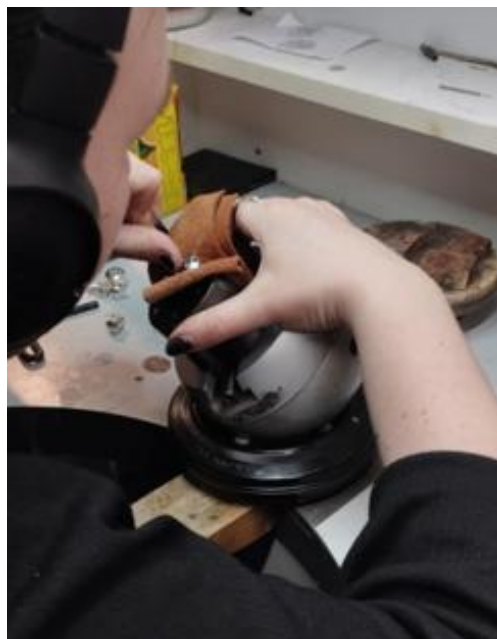
Joonis 9. Tunnelkõrvarõnga kilbi graveerimine.

Nelja väiksema kõrvarõngapaari tunnel ja kilp moodustavad suletud õõnesvormi. Metallist õõnesvormil peavad olema kindlasti augud, et sinna ei jääks sisse vedelikke ega tekiks jootmisel plahvatusohtlikku olukorda. Neid auke ei saa teha kõrvarõnga tunneli osasse, mis läbib kõrvalesta, kuna nii koguneks mustus ja surnud naharakud kõrvarõnga sisse.