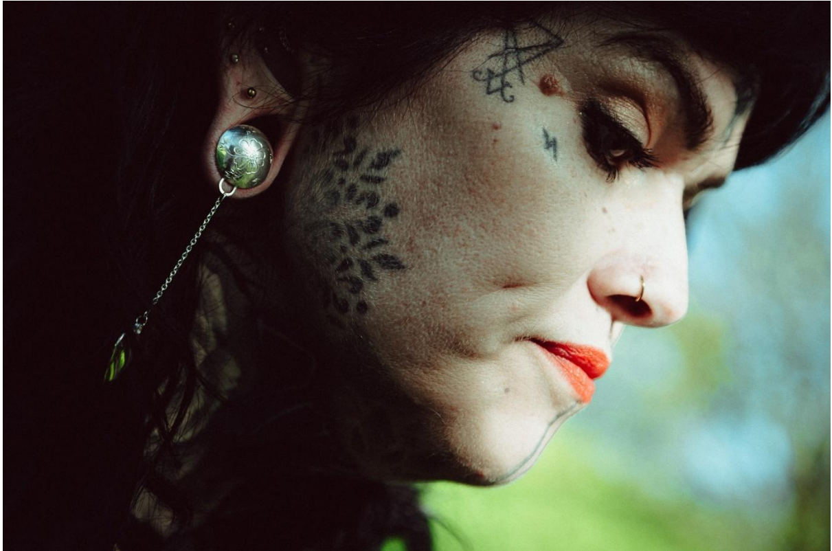
Südamekujulise ripatsiga tunnelkõrvarõngad. 16mm.