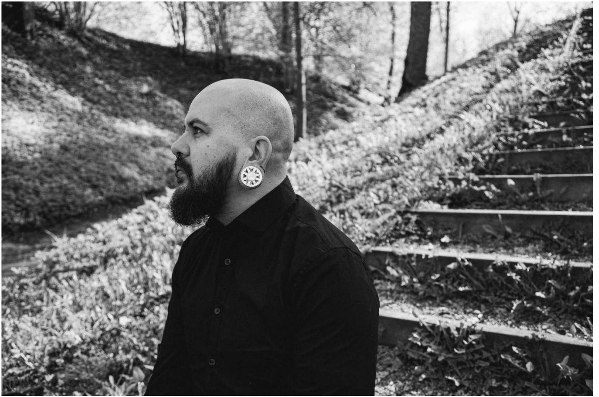
Kodarrahasi inspireeritud tunnelkõrvarõngad.