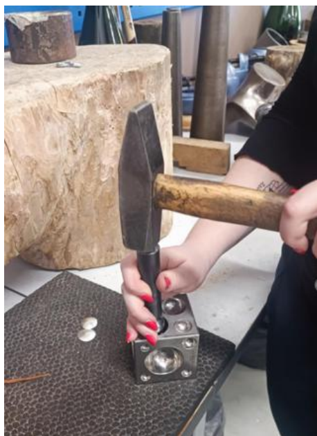
Joonis 8. Kilbi kumeraks löömine ankes.