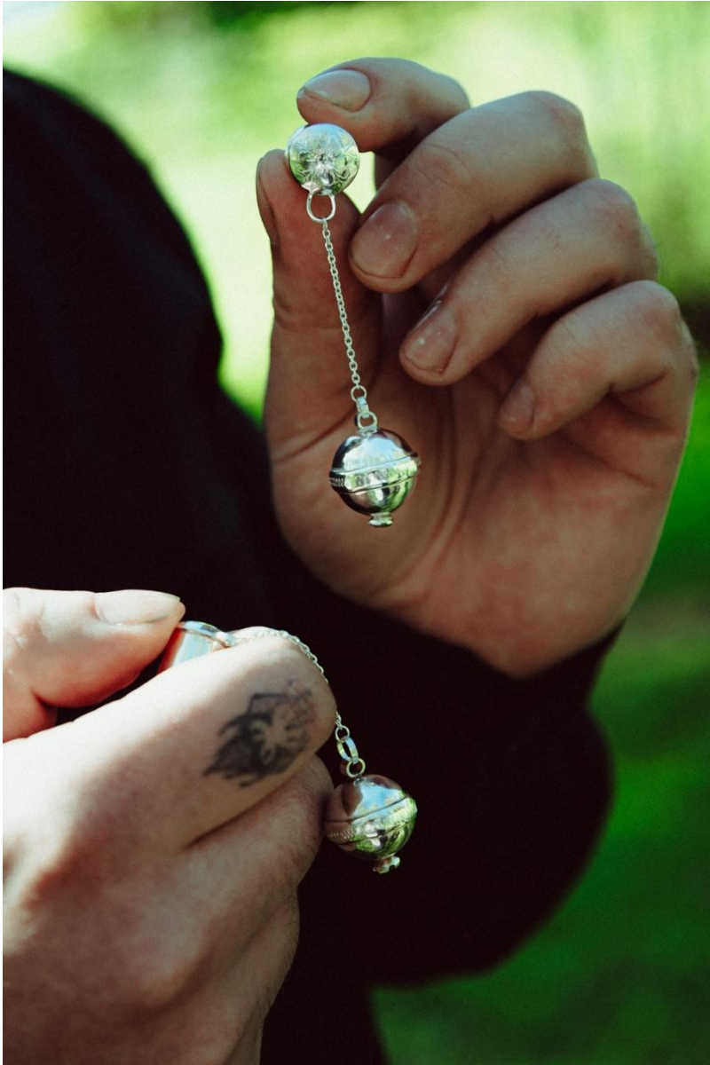
Nöpsidega tunnelkõrvarõngad. 10mm.