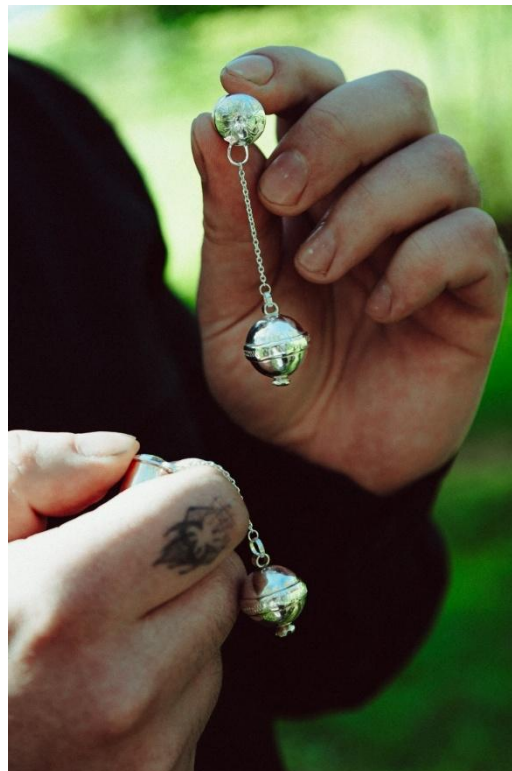
Joonis 12. Nöpsidega tunnelkõrvarõngad.

Sellest järgmisel suurusel ehk 10mm kõrvaehTEL on mõlemale tunneli külge kinnituvale kilbile graveeritud väiksemad lilled. Kõrvarõnga küljes on nöpsidest inspireeritud ripatsid, mille alumisel poolel on rohelised kivid (vt joonis 12). Setode nöpsid erinevad oma suuruste poolest, seetõttu otsustasin ka oma ripatsid teha erinevas suuruses: üks on ovaalsem ja teine ümaram. Nöpside tegemisel lõikasin esmalt 0.6 mm hõbeplekis välja kettad. Seejärel lõin need ankes kumeraks. Kumeruse astme valisin vastavalt, kas ketta kumerus moodustab poolkera. Seejärel jootsin poolkerad kokku, moodustades nii ümara õõnesvormi, mida selle töö mõistes nimetan nöpsiks. Nöpsile jootsin külge ka vöö, millele hiljem tegin dremuleeringu. Viimase jootmisena lisasin nöpsile kinnitusaasa ja kivikastiku. Rohelised