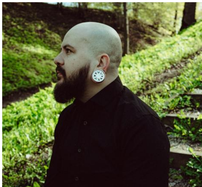
Joonis 15. Kodarrahasest inspireeritud tunnelkõrvarõngad.

Kõige suuremad ehk 30 mm tunnelkõrvarõngad on inspireeritud kodarrahasest. Algselt oli kavas ka sellele suurusele teha kumerad kilbid, kuid otsustasin jätta need kilbid hoopis lapikuks ja kaunistada väljalõigete ja dremuleeringuga (vt joonis 15). Kodarraha keskmeks oleval mündil on korduv lillemotiiv siidilindilt (8 mm ehedel on kilbil sama motiiv). Kõige keerulisem oli leida õige suuruste vahemik ažuursete kilpide ja tunneli vahel, et väljalõigatud osa ei läheks liigselt kilbist üle.