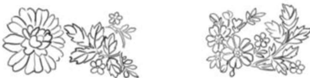
Joonis 10. Hargla naise siidipaelalt võetud lillemotiivid

Ehtekomplekti läbivaks teemaks on siidipaelalt võetud lillemotiivid, mida kombineerisin tunnelkõrvarõnga suuruse ja ripatsitega. Lillemotiivid graveerisin (vt joonis 9) tunnelkõrvarõnga mõlemale tunneli otsi katvale kilbile. Siidipaelalt motiivide valimine oli raske ja vajab vaagimist. Et oleks kergem otsustada, joonistasin Clip Studio abil otse pildilt mustri need motiivid, mis minu jaoks kõige paremini sobisid (vt joonis 10).