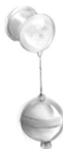
Joonis 3. 10mm tunnelkõrvarõnga kavand