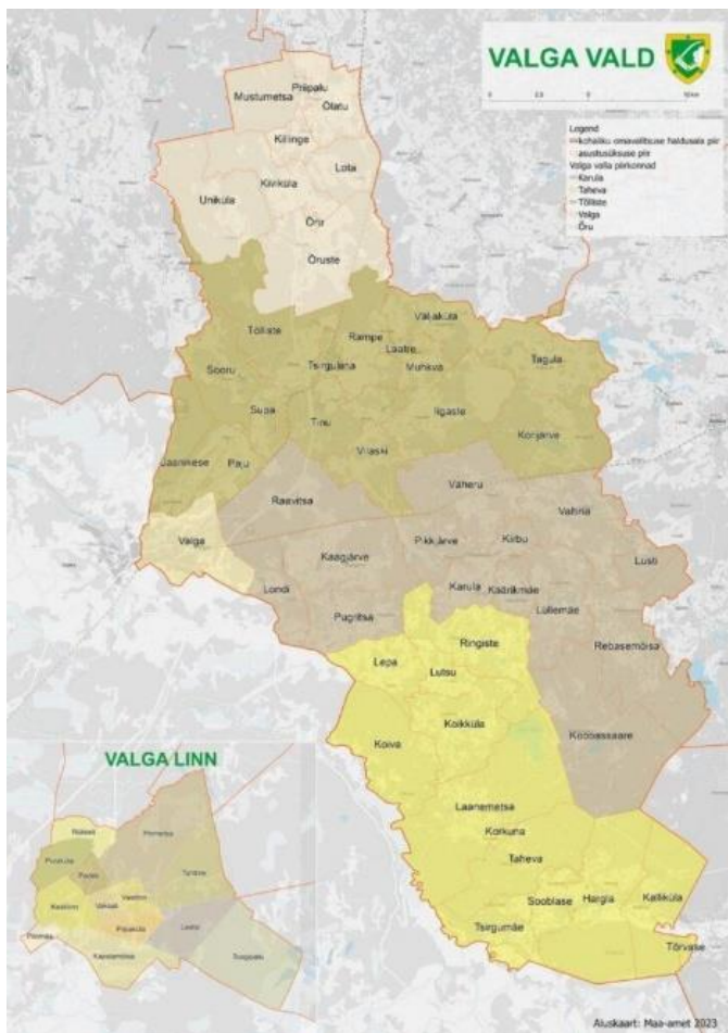
Joonis 1. Valga valla haldusjaotus. (Valga valla koduleht)

Kaardilt on näha Valga vald haldusjaotust ja paiknemist Eesti lõunaosas ning piiriülest asendit Läti Vabariigi suhtes. Kaardil on selgelt eristatud valla territooriumi koosseis, sealhulgas endiste omavalitsuste Õru, Tõlliste, Karula, Taheva ja Valga piirkonnad, mis moodustavad tänapäevase ühtse haldusüksuse (vt joonis 1). Samuti on esitatud asustusstruktuur, hõlmates linnakeskust, alevikke ja külasid, mis on olulised kultuurikorralduse strateegilise planeerimise seisukohalt. Haldusreformi järgse kaardi analüüs võimaldab mõista, kuidas valla geograafiline ja territoriaalne jaotus mõjutab kultuuritegevuste kättesaadavust ning piirkondade vahelist kaasatust.