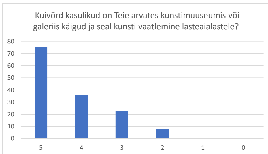
Joonis 6. Kuivõrd kasulikud on Teie arvates kunstimuuseumis või galeriis käigid ja seal kunsti vaatlemine lasteaialastele?

Kuivõrd kasulikud on lasteaialaste jaoks käigid kunstimuuseumis või galeriis ja seal kunsti vaatlemine? Umbes pool ehk 52,8% õpetajatest arvasid, et käigid kunstimuuseumis ja galeriis on lasteaialastele väga kasulikud. Veerand, 25,4% õpetajatest aga märkisid oma vastusena “4”. 16,2% vastanutest valisid skaalal 0-5 oma vastusena “3”. 5,6% õpetajatest valisid skaalal “2”. Mitte keegi ei valinud skaalal “1” ega “0”, see tähendab, et mitte keegi õpetajatest ei pidanud õppekäike kasutatuteks. Diagrammist (vt Joonis 6) on näha, et paljude õpetajate arvamusel on kunstimuuseumis ja galeriis käigid lasteaialastele väga kasulikud.