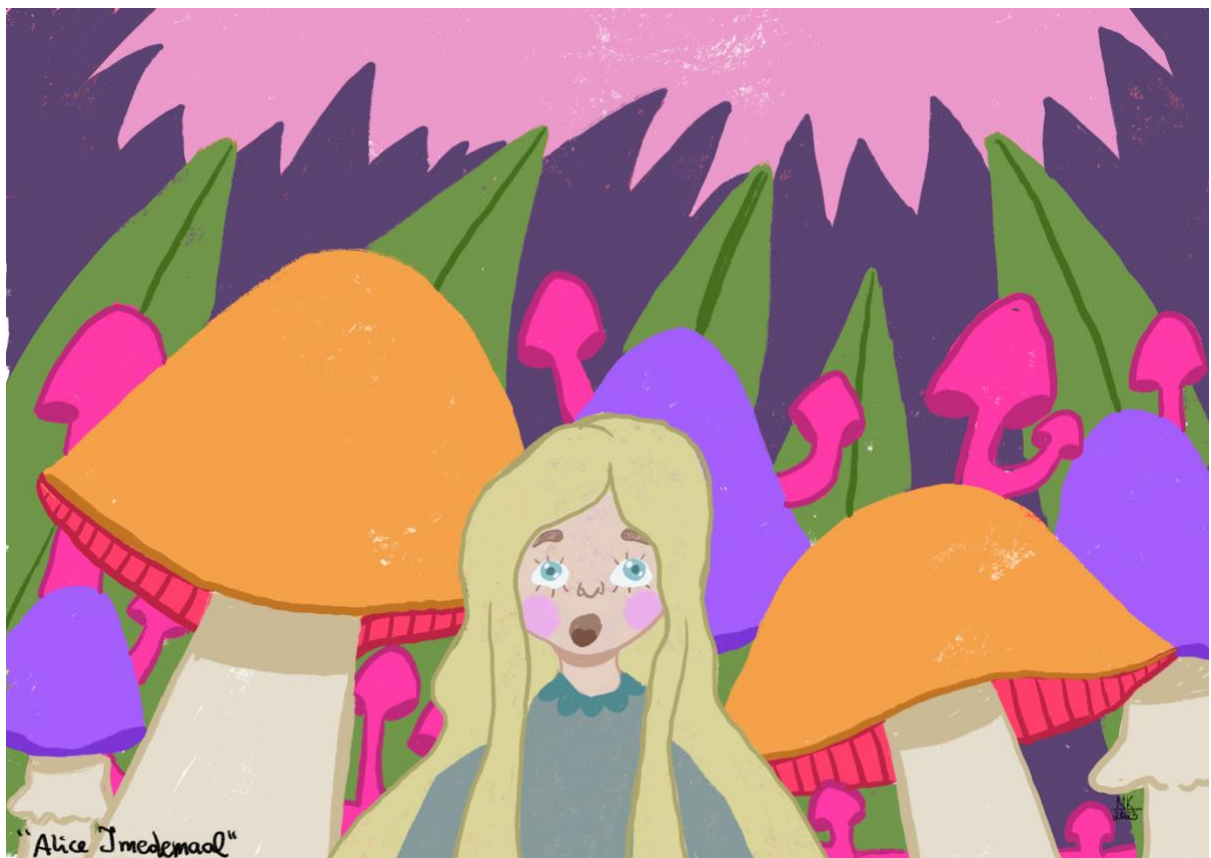
Joonis 4. Muinasjutt "Alice Imedemaal"