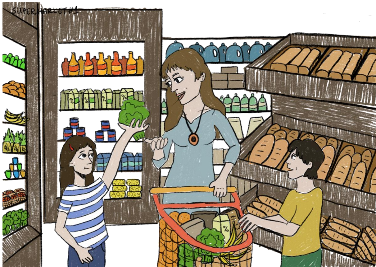
Joonis 2. Supermarket