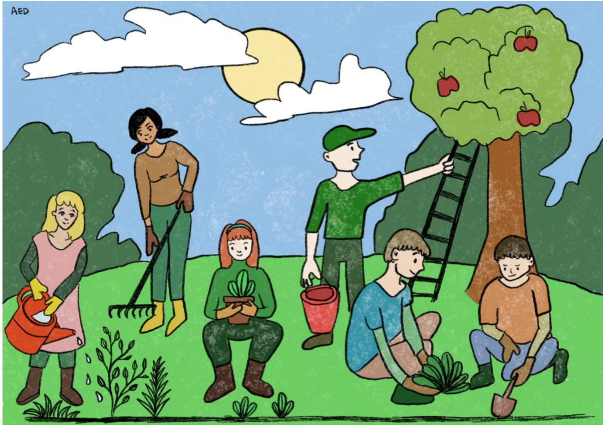
Joonis 1. Aed