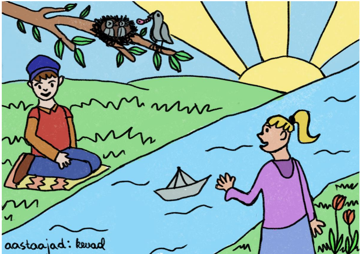
Joonis 3. Aastaajad: kevad