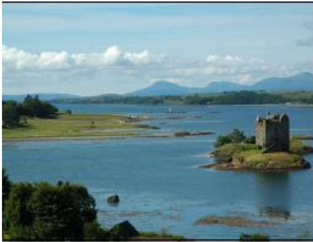
Lisa 3. PowerPoint esitlus teema tutvustamiseks.