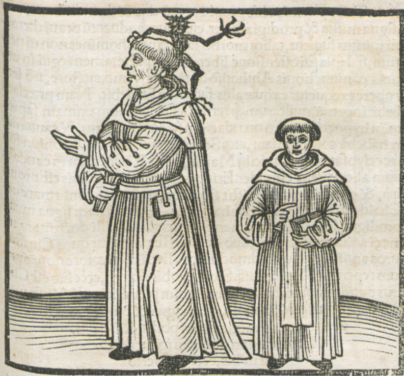
CAPVT TRICESIMVM TERTIVM

MONACHVS IN ALBA CVCVLLA, & diabolus in scapulis eius, retro habens leripium longū ad terram cum amplis etiam brachijs, habens discipulum secum stantem.