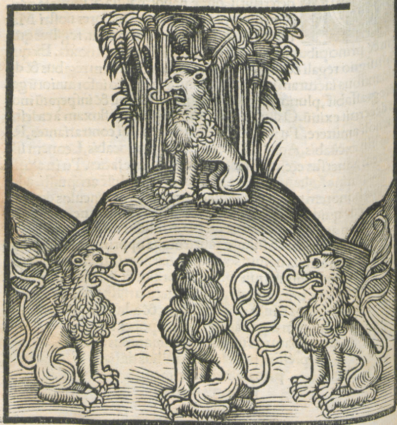
CAPVT VICESIMVMQ VARTVM,

LEO SVpra MONTEM CORONATVS, & tres leones secum sub monte.