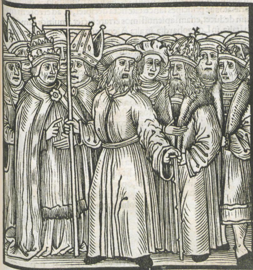
CAPVT TRICESIMVM QVARTVM.