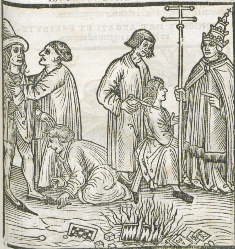
CAPVT TRICESIMVM Q VINTVM.

HIC IVENTVR COMBURI ALEAE ET uestes saeculares difformes, rostra calceorum iuxta Papam abscindi, & pili decur- tari per hunc prophetam