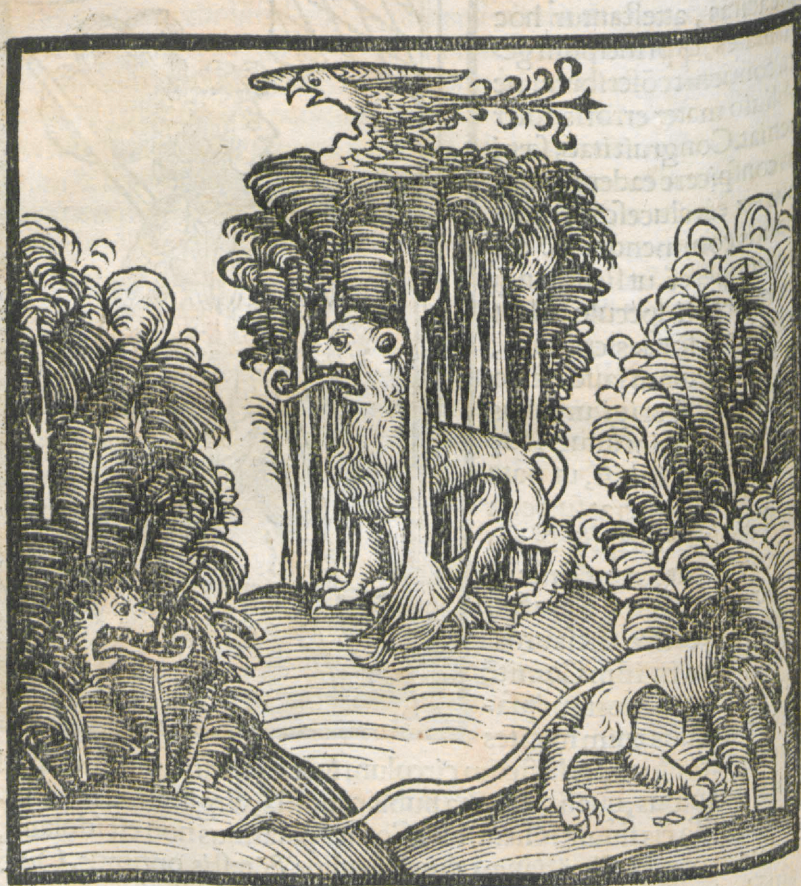
CAPVT VICESIMVM TERTIVM.

AQ VILA SVpra SILVAM VOLANS sub una silua Leo medius videtur, sub alia silua Leo totus videtur, sub tertia Leo absconditur.