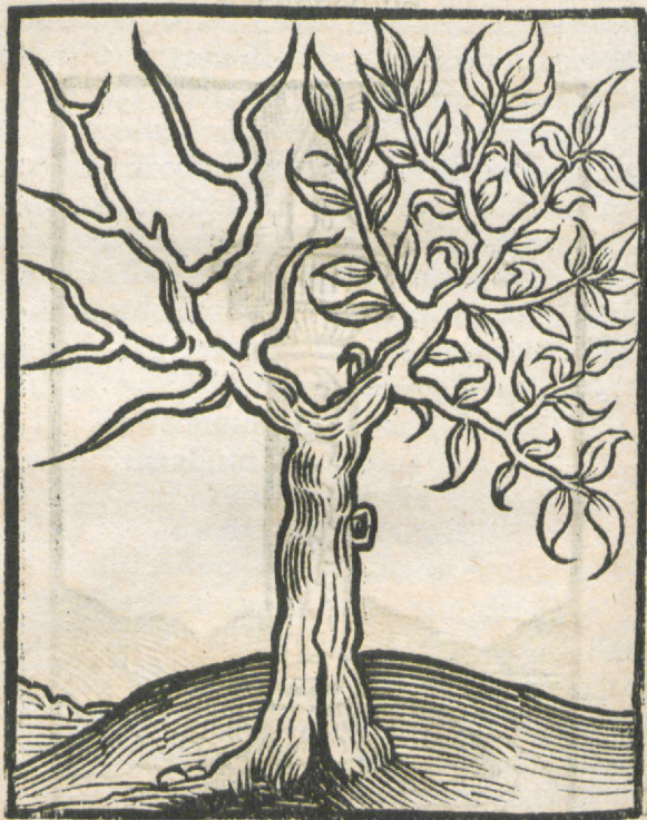
CAPVT VICESIMVM Q VINTVM.

ARBOR TVRCORVM CVM Q VINDECIM ramis, quorum medietas est arida.