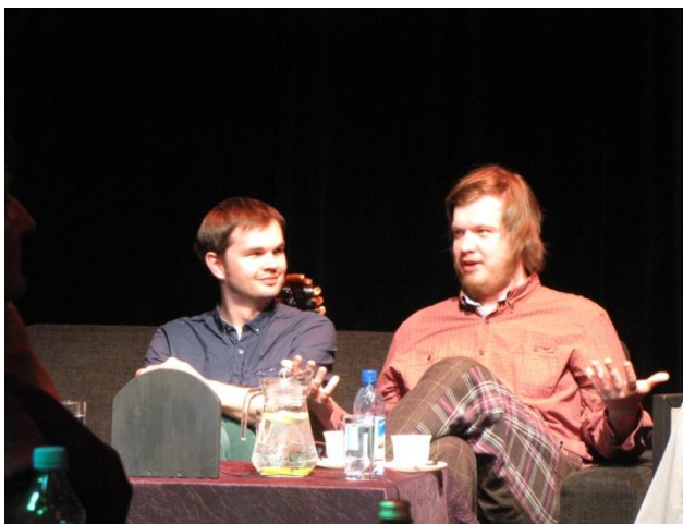
Vaiko Eplik, Chalice.