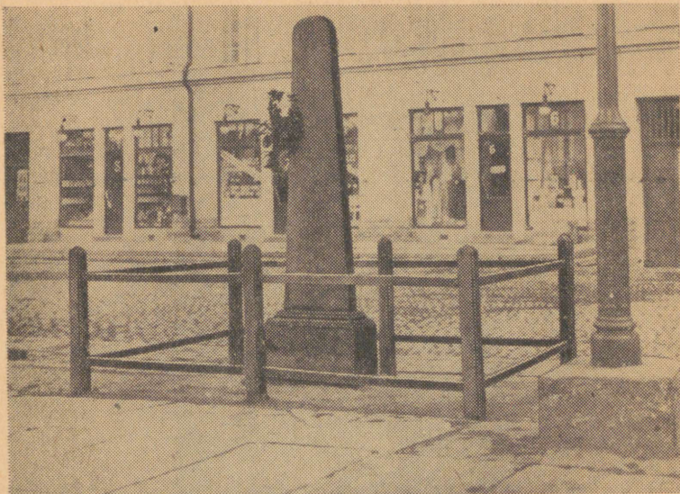
16. oktoobri veretöö ohvritele püstitatud esialgne mälestussammas Uuel turul (foto 1935. a.).