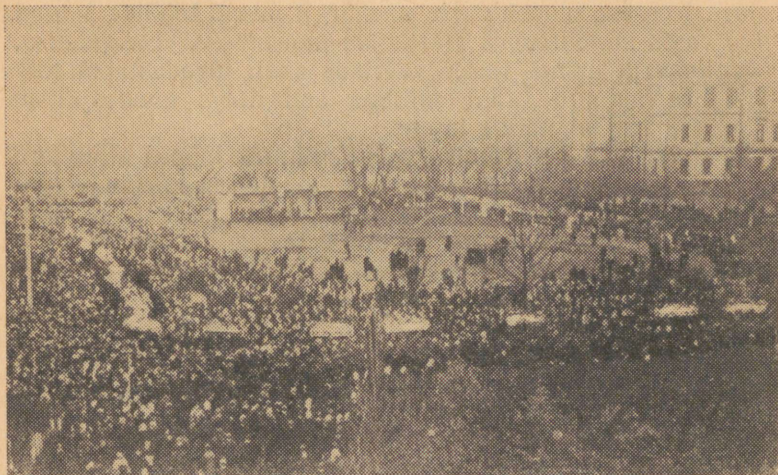
Uuel turul tapetud tööliste matused 20. oktoobril 1905.

ka õhtul «Estonias», kus nad nõudsid veretöö süüdlaste karistamist ja linnavalikogu laialisaatmist. Poliitilised koosolekud «Estonias» ja vabrikutes kestsid mitu päeva järjest.