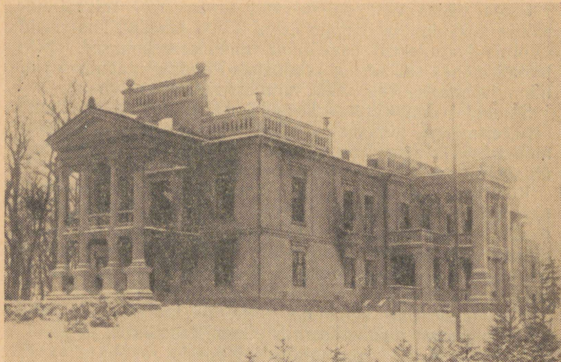
Ülestõusnud tööliste ja talupoegade poolt põletatud Tuhala mõisa härrastemaja Kose kihelkonnas.

kulakud olid arreteerinud viis revolutsionääri, ja vabastas nad. Halinga kulakute jõuk löödi puruks.