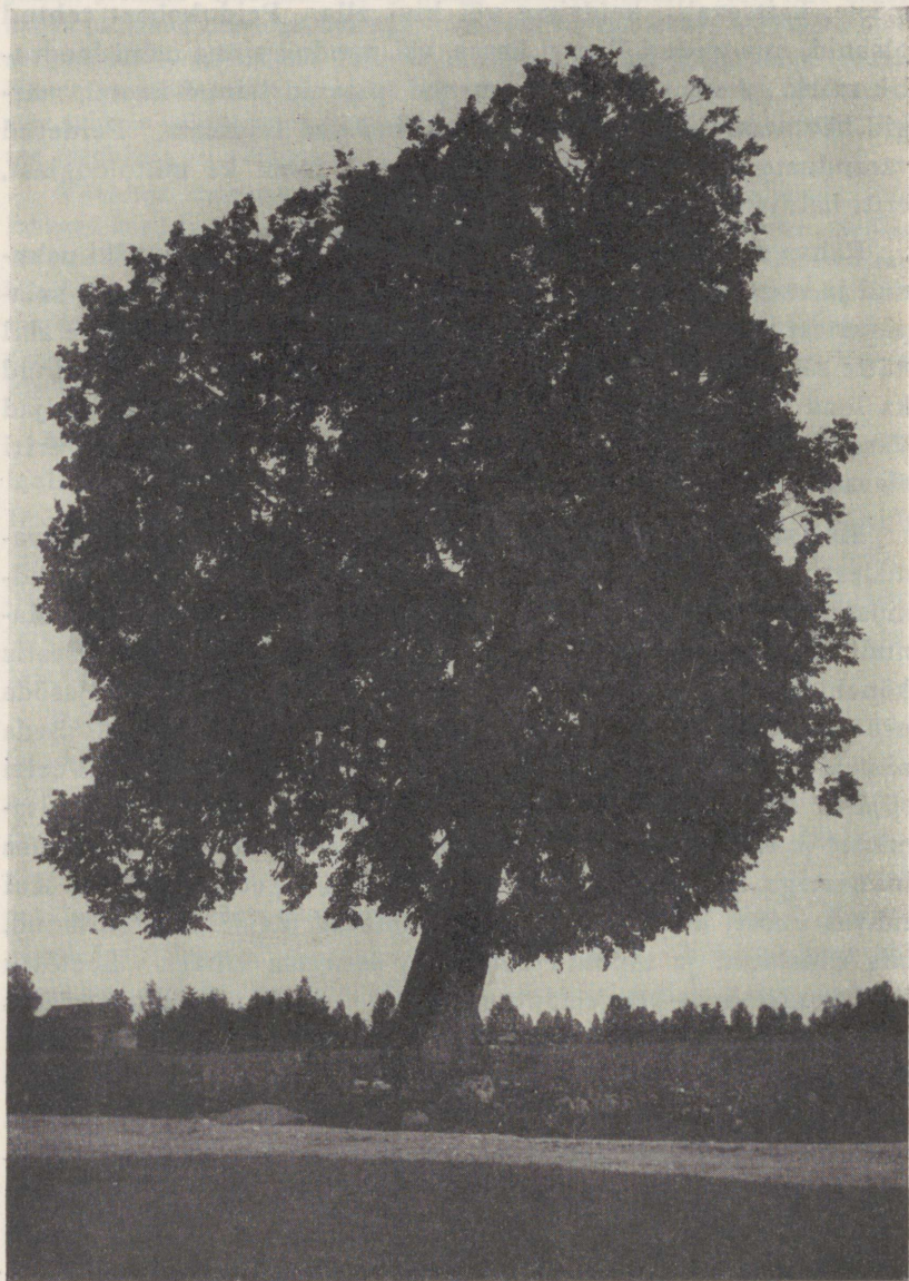
153. joon. Vana ohvripärn Uduveres, Pärnu-Jaagupi khk. 1913. a.

reetnud külarahva peidupaiga, kuid tapetud ise esimesena. Põgenevad naised sünnitanud kadakapõõsais lapsi, kes elanud nädalate viisi metsas ainult soola imemisest. Kes jäänud vaenlaste kätte, see tapetud metsikult