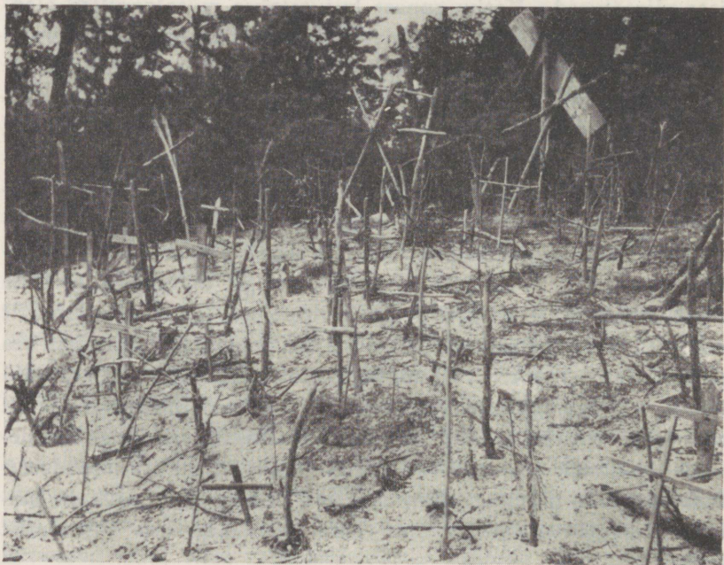
154. joon. Ristimägi Keina khk. Hiiumaal. (Pildist. C. S a r a p.)

nagu uudismaid üles harima. Kõneldakse ka rahva sisserändamisest teistest paikadest, näit. Harjumaalt Pärnu ümbrusse, Hiiumaalt Saaremaale jne. Toodud kohale ka teisi rahvaid, nõnda Kuramaalt Saaremaale, Lätimaalt Urvastesse, Soomest Kosele ja Mustjalasse, Venemaalt Suure-Jaani, Kodaveresse ja Hallistesse. Isegi mustlasi ja kaukaaslasi toodud Lõuna-Eesti ääremaadesse, kes aga kõik sulanud kokku maa pärisrahvaga ja läinud kaasa uue ärkava eluvooluga.