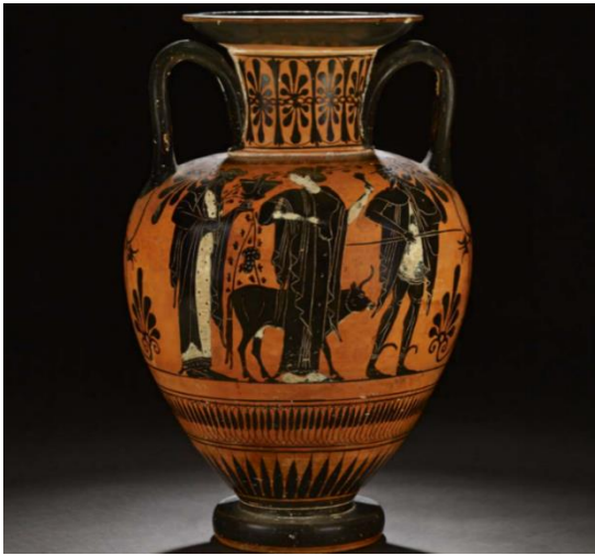
Dionysos, Ariadne ja Hermes. British Museum, London. Kättesaadav: https://www.britishmuseum.org/collection/object/G_1836-0224-170 .