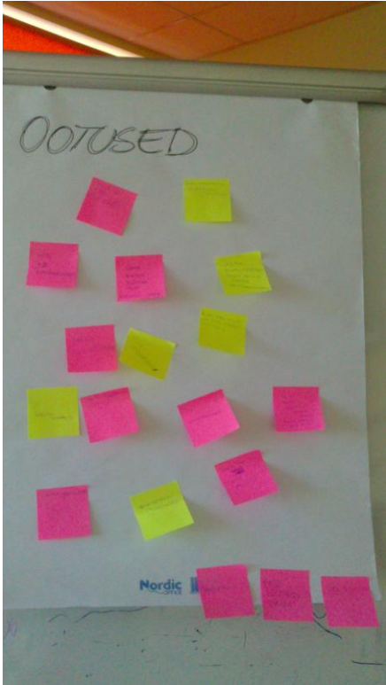
Koolituspäeval kaardistatud ootused 24.05.2014