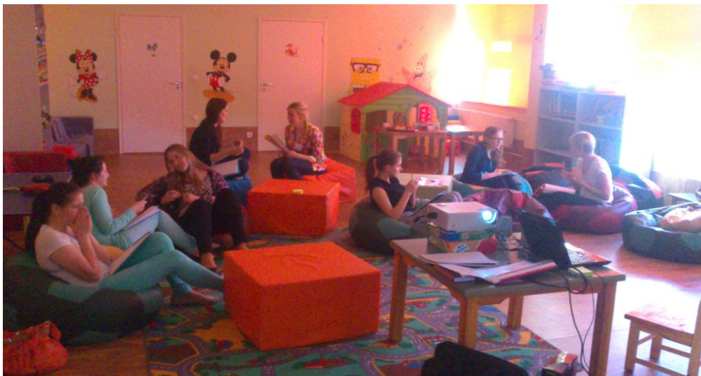
Osavõtjad (Paide) 25.04.2014