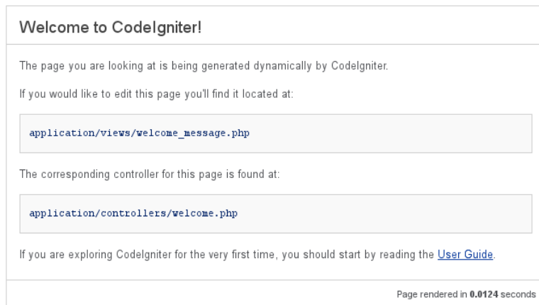
Joonis 1: CodeIgniter raamistiku vaikimisi avalehekülg

CodeIgniter raamistiku paigaldamine ja seadistamine on küllaltki lihtne ja seetõttu on antud raamistik sobilik ka väheste kogemustega kasutajatele. Raamistikku saab alla laadida arendaja kodulehelt ( http://http://ellislab.com/codeigniter/download ). Raamistiku kasutamiseks tuleb allalaetud fail sobivasse kohta lahti pakkida ja veebiserverisse kopeerida. Vastavalt kasutaja eelistustele tuleks lahtipakitud kataloogi nimeks anda konkreetse projekti nimi. Eduka paigalduse puhul kuvatakse kasutajale joonisel (Joonis 1) toodud veebilehekülg.