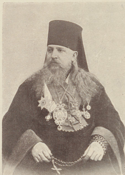
АГАНГСАХ, ЕПИСКОПЪ РИЖСКІЙ И ЖИТАВСКІЙ.