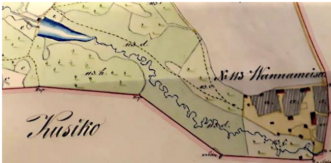
Joonis 4. Lapi järv ülespaisutatud Lemmjõel 1867. a Vanamõisa 113 (Lapi talu) talu kaardil (EAA.2469.1.10077, leht 12).

Lapi järv. Praegu on seal Lapi talu karjamaa, kraavitati kuivaks. 30 aastat tagasi olevat seal veel järv olnud, seal olnud siis ka Vanamõisa veski. [39] (365943)