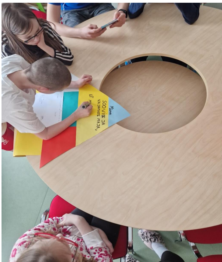
Pilt 2. Majale pealkirja andmine.