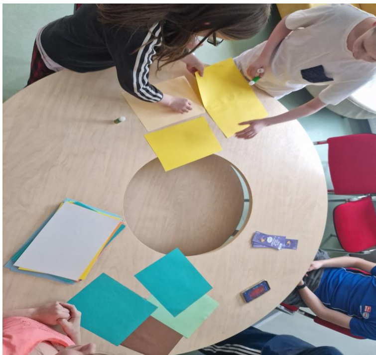
Pilt 1. Minu soovide ja vajaduste maja meisterdamine.