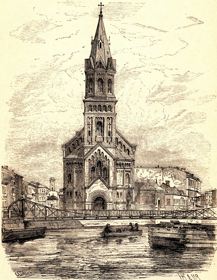
Die deutsche reformirte Kirche.