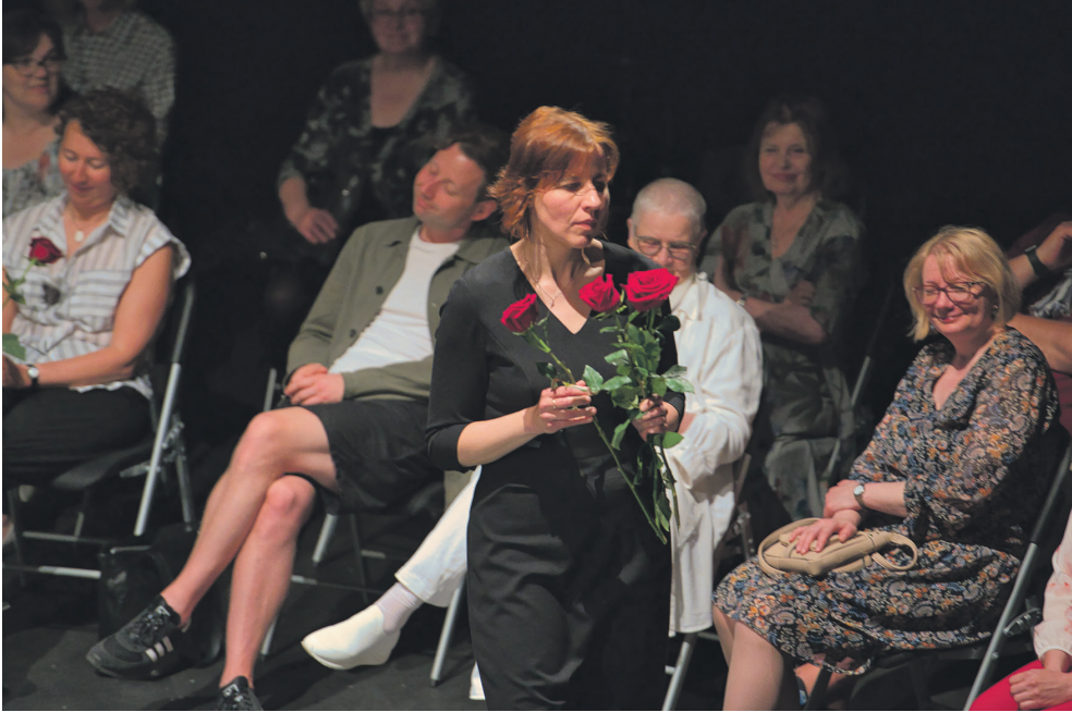
Foto 2. Foto lavastusest „Minu Narva – Моя Нарва”. Autor: Meelis Muhu.

osalejate endi huvist kantud arutelude vastustest esile Narva sotsiaalse mitmekesisuse ja tuleviku temaatika, mistõttu sai oluliseks küsimuseks, kes soovivad Narvas elada ja miks, kui tõmme pealinna ja välismaa suunas on suur. Sellest lähtuvalt tekkis näidendisse kategooria „tulekud-minekud”, mille kohta esitasime lisaküsimusi ja mille põhjal loime stseene. Kategoorias selgitasime välja Narvast mineku, tagasituleku või sinna jäämise põhjuseid (nt tööränne, teise linna õppima minek, missioonitundest Narva elama tulek, kodulinna-armastus, oluline identiteet Narva elanikuna jne) ning soovisime tuua esile, kuidas inimesed neid põhjusi kirjeldavad.