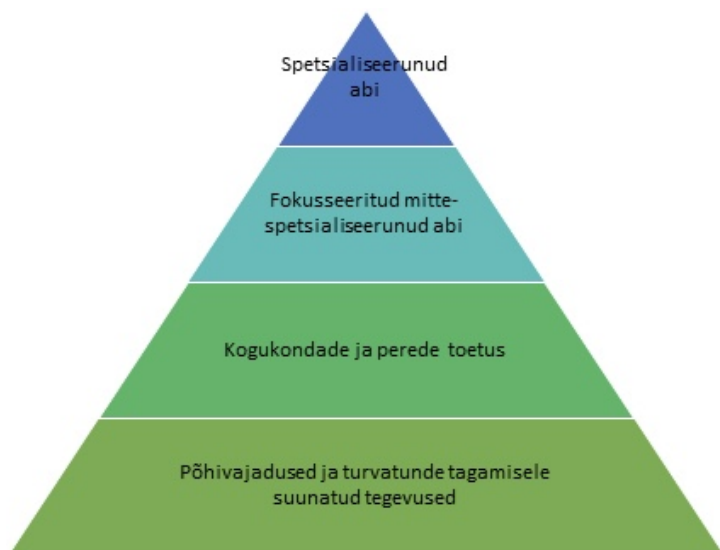
Joonis 2. Psühhosotsiaalse heaolu ja vaimse tervise abi sekkumispüramiid (IASC) tõlgitud: TAI poolt (2022)

on soovituslik rakendada kõiki toetustasemeid korraga (UNHCR, 2022). Sotsiaaltöötaja, kes tegeleb Ukraina sõjapõgenikega peab arvestama sellega, et kõik Ukraina sõjapõgenikud pole traumeeritud. Eeldades, et iga Ukraina sõjapõgenik on traumeeritud, õõnestab see tema toimetulekumehhanismi, mis võib omakorda tekitada õpitud abitust, st pole soovi enda elutingimusi parandada, kuigi tegelikult on inimene selleks võimeline (UNHCR, 2022). Samuti tekitab selline eelduslik mõtteviis sotsiaaltöötaja poolset stigmatiseerimist (UNHCR, 2022).