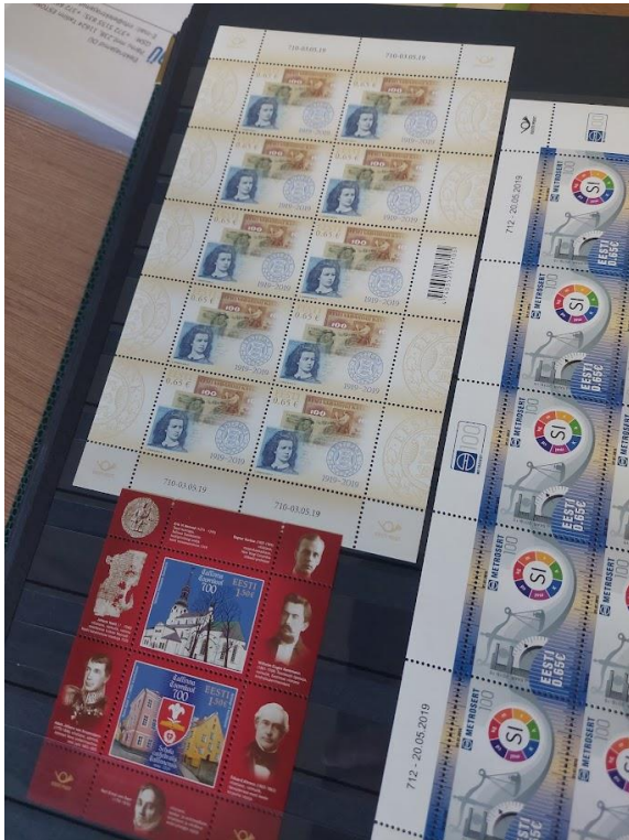
Foto 8: Oluline Facebooki grupp filateliahuvilistele markide vahetamiseks ja müümiseks.

Foto 7: Üleval vasakul: margid, mis kujutavad Eesti Vabariigis välja antud sajakrooniseid rahatähti. All vasakul: ajaloo sündmusi ja ajaloolisi isikuid kujutav margileht.