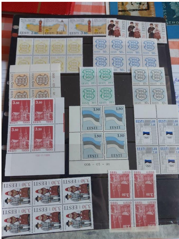
Foto 10: Peamiselt Esimese Eesti Vabariigi aegsed margid Henno kogust.