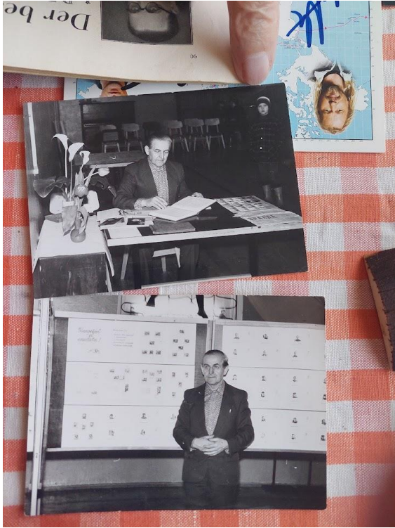
Foto 2: Näide maailma esimese margi „Musta penni“ (ing k Penny Black ) repost.

Foto 1: Informant Henno filateelianäitusel.