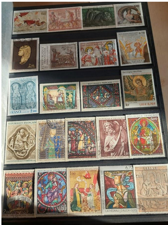
Foto 6: Valik Prantsusmaa marke Peetri kogust. Esindatud ka skulptuure kujutavad margid.