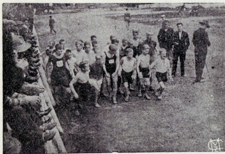
Poiste spordiliidu võistlused. 1000 meetr. jooksu start.