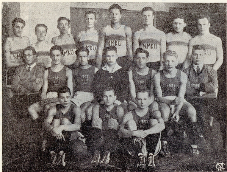
Riia N. M. K. Ü. käsipalli meeskond Tartus.

Samal pildil olev Tartu Ühingu meeskond tuli võrkpallis Eesti meistriks.