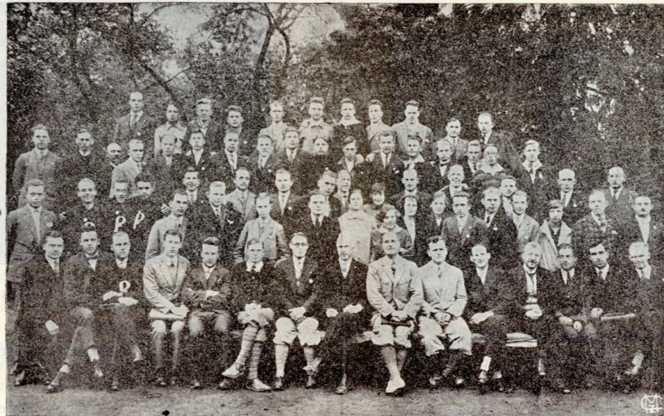
VI Balti N. M. K. Ü. tegelaste suvekool. Peeti käesoleval aastal 10.—24. juunini Tartus. Osavõtjaid oli Eestist, Soomest, Lätist ja Poolast — kokku 87 isikut.