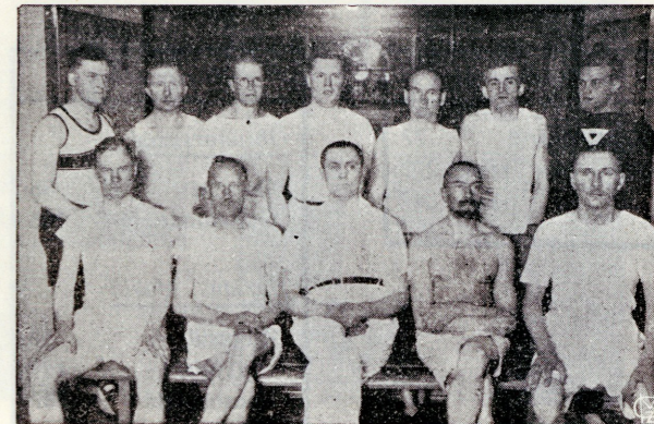
Vanemate härrade grupp võimlas

Noorte Meeste Kristlik Ühing pakub sarnastele aga palju ja mitmekesiselt huvitavat tegevust, mis eemaldab neid pahedest ja rakendab nende noorustuld loovale, enesekas-vatuslisele tegevusele. Poistele meeldib Ühingu töö ja nad käivad rohkel arvul Ühingus. Ühingu ja seltskonna kohus on sarnastele poistele kasulikku ja lõbusat tegevust või-maldada.