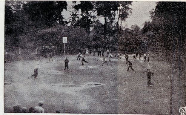
Poiste võistlused Ühingu spordiplatsil.