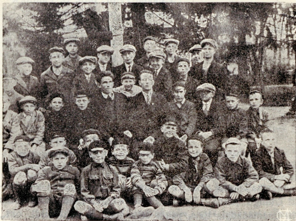
Need, kes vajavad Ühingut.

Ülalseisev pilt kujutab poissa, milliseid liigub iga päev rõhuvas enamuses Ühingus käijate hulgas. Sarnastel poistel jääb iga päev tund ehk paar vaba aega üle. Sarnased terased poisid vajavad tegevust. Tihti näete selleealisi poissa kusagil linna ääres ehk luhal vallatamas ja kõlblisvastaste mõjude all aega suinuks löömas.