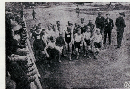
Poiste spordiliidu võistlused. 1000 meetri jooksu start.