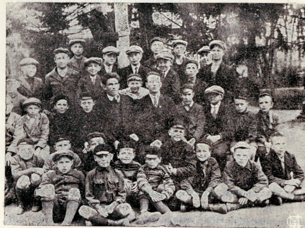
Need, kes vajavad Ühingut.

Ülalseisev pilt kujutab poissa, milliseid liigub iga päev rõhuvas enamuses Ühingus käijate hulgas. Sarnastel poistel jääb iga päev tund ehk paar vaba aega üle. Sarnased terased poisid vajavad tegevust. Tihti näete sellealisi poissa kusagil linna ääres ehk luhal vallatamas ja kõlblis-vastaste mõjude all aega surnuks lõomas.