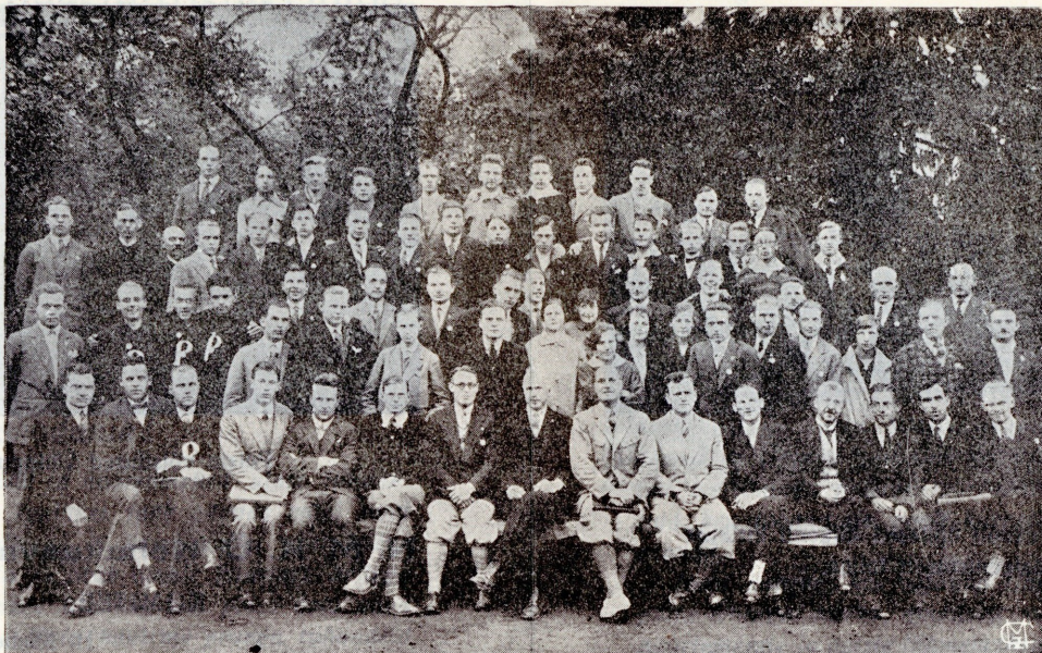
VI Balti N. M. K. Ü. tegelaste suvekool. Peeti käesoleval aastal 10.—24. juunini Tartus. Osavõtjaid oli Eestist, Soomest, Lätist ja Poolast — kokku 87 isikut.