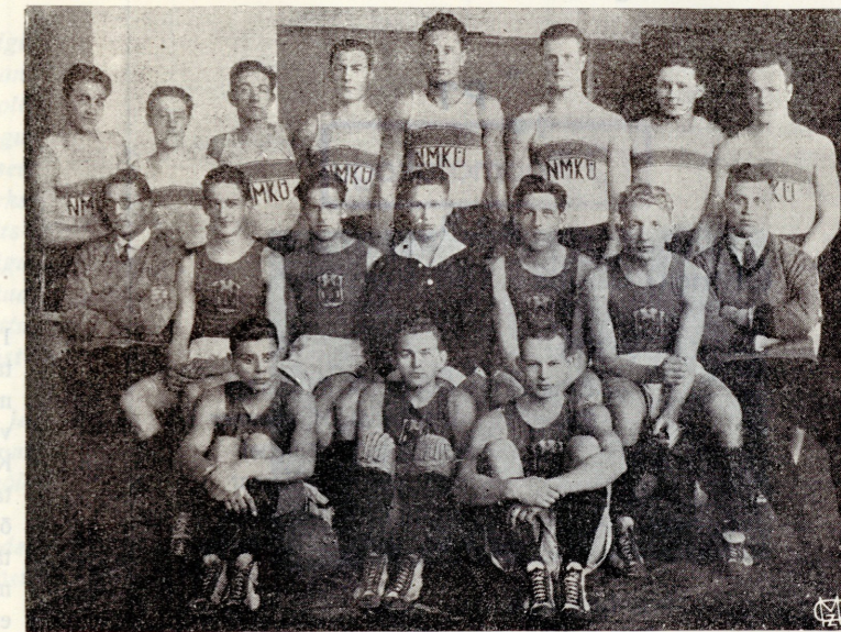
Riia N. M. K. Ü. käsipalli meeskond Tartus. Samal pildil olev Tartu Ühingu meeskond tuli võrkpallis Eesti meistriks.