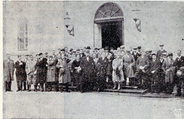
N. M. K. Ü. suvekooli õpilased ülikooli kirikust jumalateenistusest tulles.