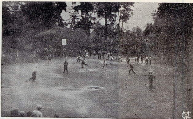
Poiste võistlused Ühingu spordiplatsil.