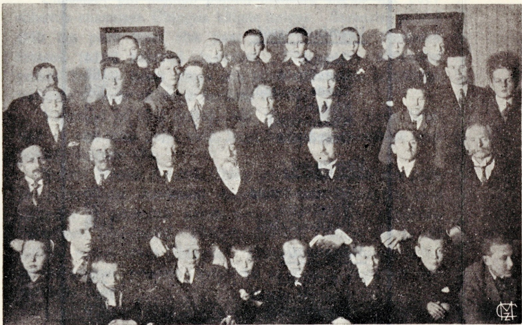
Isa ja poja õhtu.