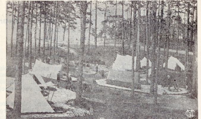
N. M. K. Ü. skautrühm Läti Suurlaagris.