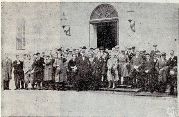
N. M. K. Ü. suvekooli õpilased ülikooli kirikust jumalateenistusest tulles.