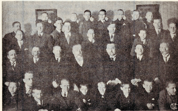
Isa ja poja õhtu.