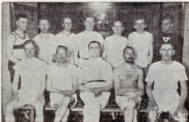
Vanemate härrade grupp võimlas