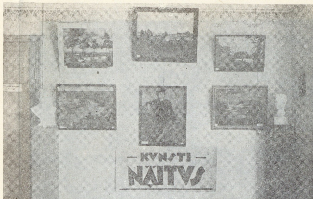
K. K. Klubi korraldusel peeti 29. IV. — 6. V. 28