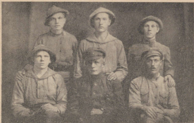
Grupp 5. Eesti Kommunistliku Kütipolgu võitlejaid tollaegses vormiriietuses (Dvinski rindel 1919. aastal).

Ukraina ja liikudes edasi vallutasid nad Orjoli ning lähenedes Tuulale, kes varustas meie armeed padrunite, vintpüsside ja kuulipildujatega. Vaenlane püüdis kiiresti Moskvasse jõuda. Oli vaja mitte ainult peatada, vaid ka purustada Denikin. Trotski kui Lõunarinde desorganiseerimise peasüüdlane tagandati Punaarmee operatsioonide juhtimiselt lõunas ning Denikini purustamine pandi partei Keskkomitee poolt seltsimeestele Stalinile, Vorosilovile, Ordžonikidzele ja Budjonnoile. Lõunarindele suundus kiire korras uusi Punaarmee väeosasid, tuhandeid vabatahtlikke noorte hulgast. Eesti väeosadesse, mis koondati 14. oktoobriks 1919 täielikult Hotõnetsi jaama rajooni (Brjanski—Orjoli raudteel), saabus samuti uut täiendust. Eesti brigaadi moodustamine kahebrigaadiliseks diviisiks viidi lõpule 2—3 päeva jooksul ja juba 15. oktoobriks oli diviis täielikult lahinguvalmis.