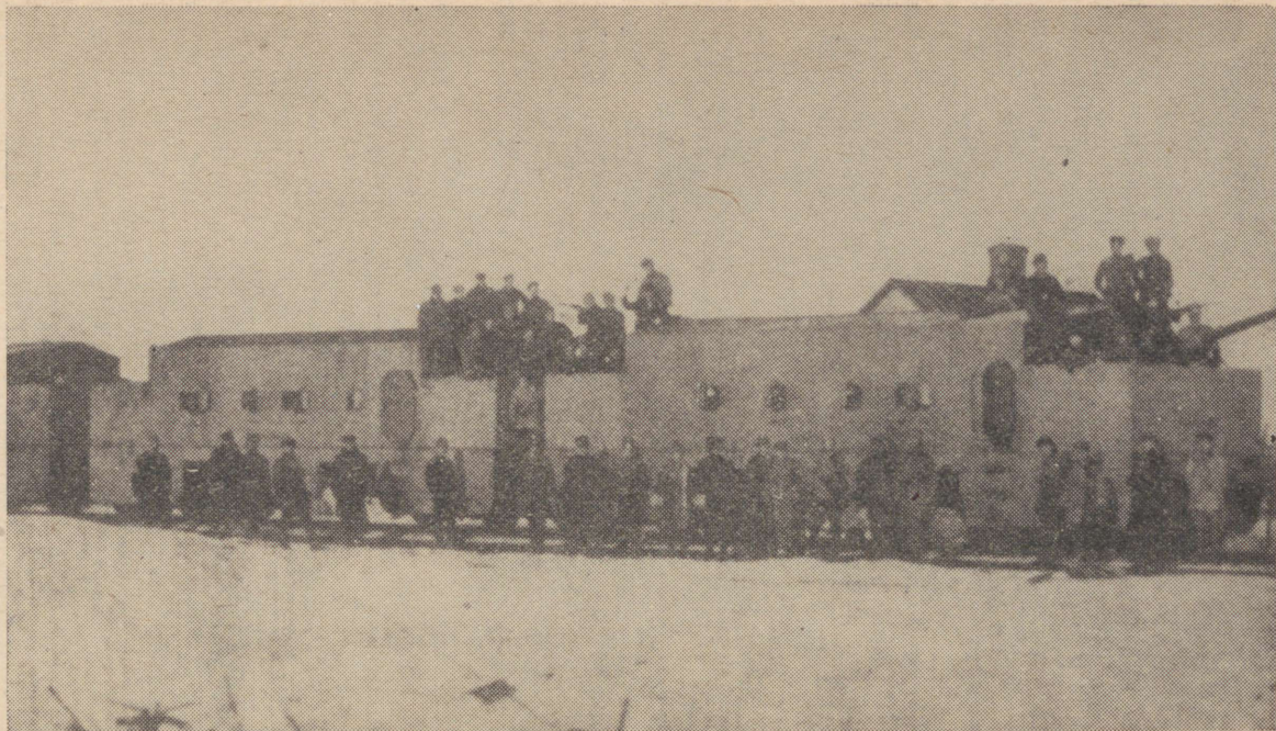
Eesti Kütidiviisi soomusrong Pihkva-Võru rindelõigus 1919. aastal.