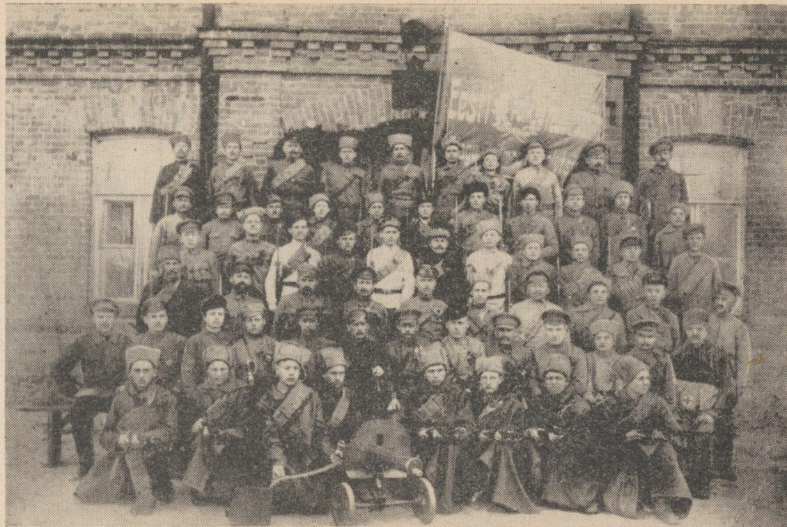
Eesti Revolutsioonilise Kaitsepolgu võitlejaid 1919. aastal.