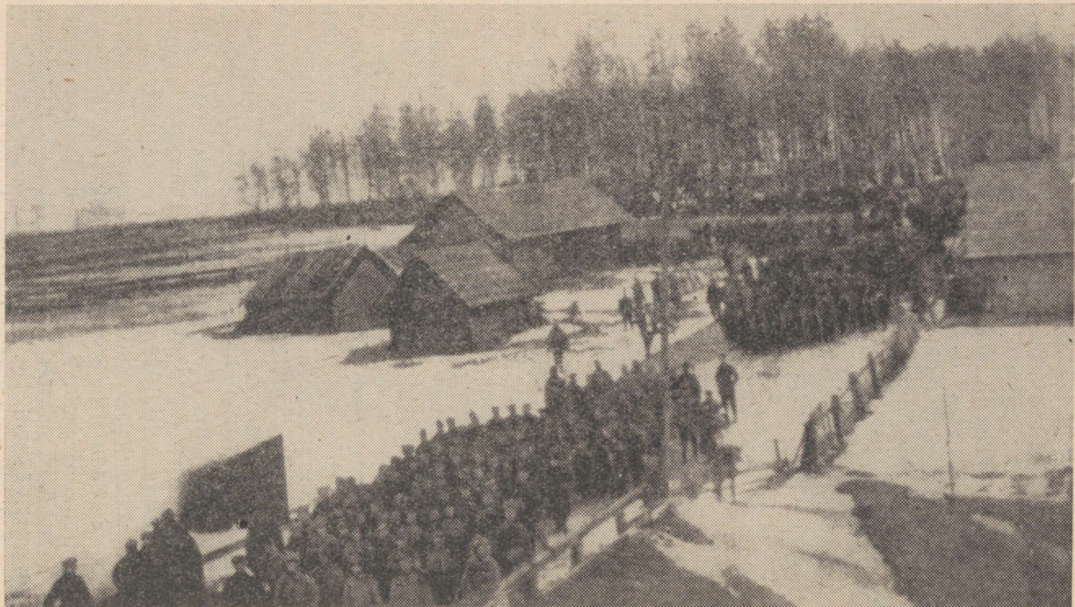
5. Eesti Kommunistlik Kütipolk rännakul Marienburgist rindele (1919. a. veebruaris).