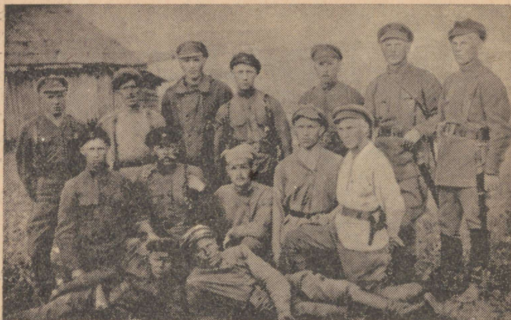
6. Eesti Kommunistliku Kütipolgu staap ja juhtiv koosseis (1919. a. juulis).

sid verised lahingud. Valgepoolakatel oli üle 20 suurtüki, neist osa kaugelaske-suurtükid, samal ajal kui eesti brigaadil oli kõigest seitse 3-tollist suurtükki. Peale selle oli valgepoolakatel 7 tanki, milledega eesti sõjamehed kohtusid esmakordselt. Kuid see ei murdnud meie sõjameeste ja komandöride kõrget võitlusvaimu. Käsitsilahingud kestsid kaua, eriti Grivka silla — Dvinaast ülemineku koha rajoonis. Et takistada valgepoolakate juurdepääsu linnale, purustati sild meie suurtükiväe poolt. Ja seda vaatamata sellele, et pärast selle ainukeses silla hävitamist ei jäänud eesti brigadi väeosadele teed taandumiseks, välja arvatud üks ebakindel ujuksild, mis oli ehitatud eelmisel päeval brigadi jõududega. Valgepoolakate löögid tugevnesid ja nende tagasitõrjumiseks ei jätkunud enam jõudu. Eesti sõjamehed võitlesid viimase võimaluseni mehiselt ja ennastsalgavalt. Nad kandsid suuri kaotusi, kuid kaitsesid Dvinski.