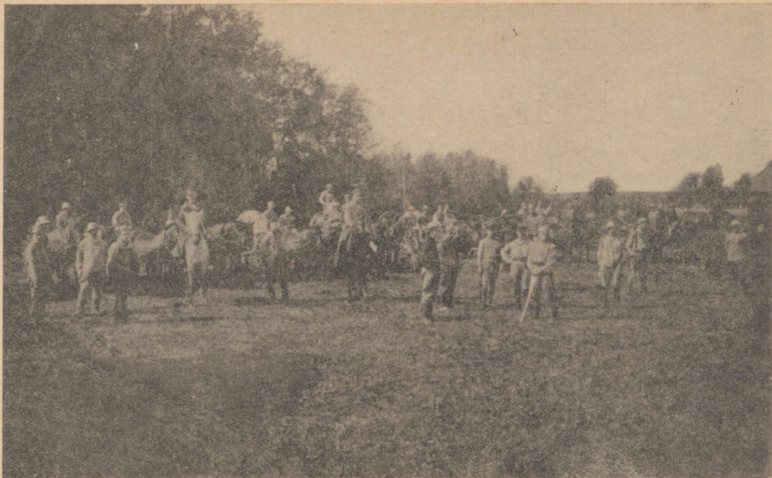
Eesti Ratsapolgu võitlejad Pihkva rindelõigus (1919. aastal).