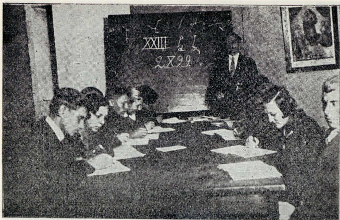
Stenograafia (kiirkirja) kursus.