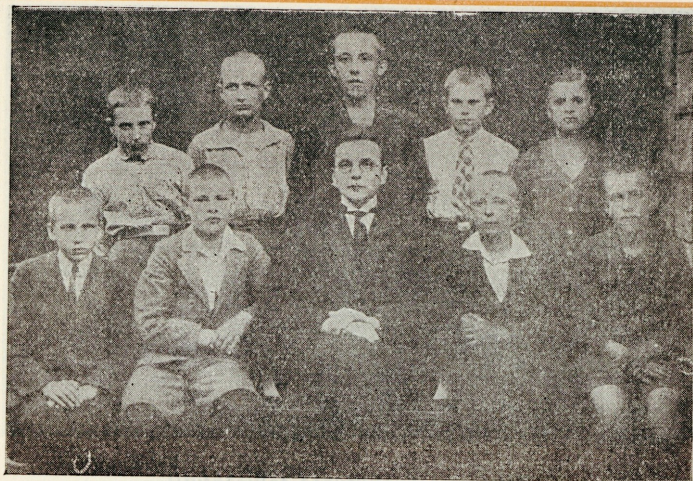
Poiste klubi juhatajaga.