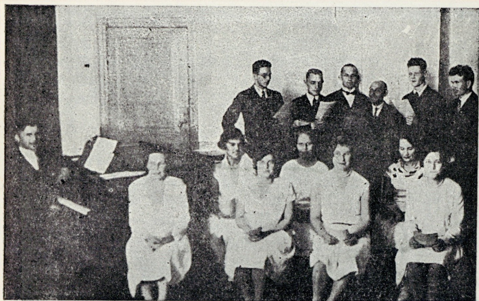
Ühingu segakoor (hiljuti asut.)