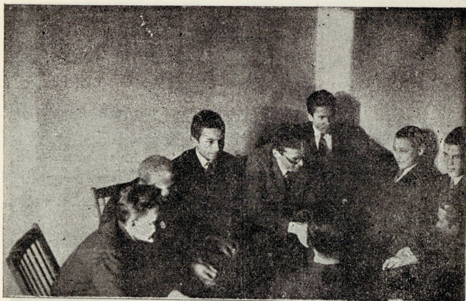
Juht oma poistega juttu vestmas.