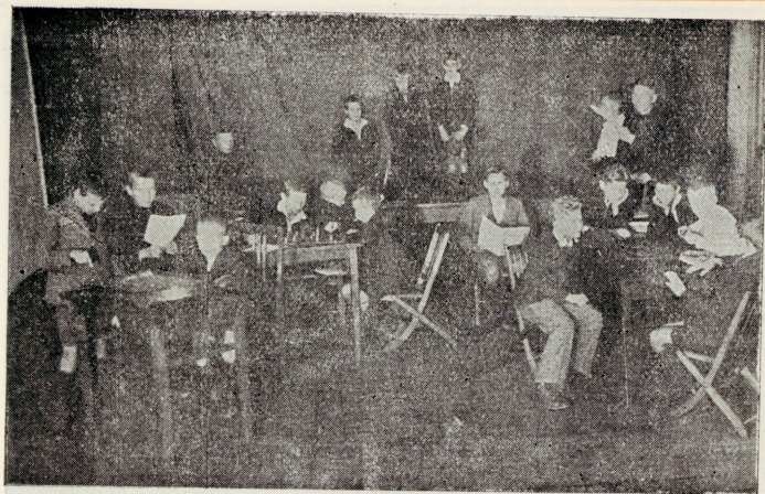
Poiste meelelahutused talveõhtuil.