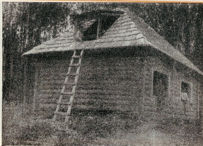
Poiste onn Vasula järve ääres.