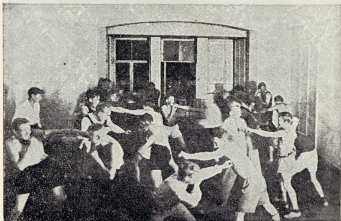
Kehakarastus Ühingu saalis.