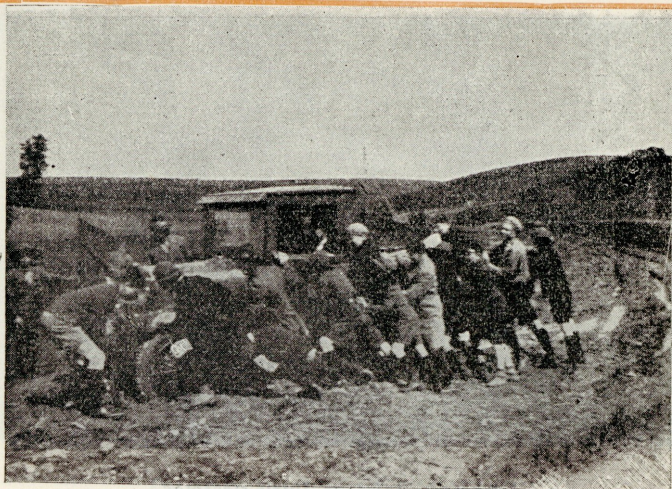
Ühingu skautrühm laagri sõitmas.