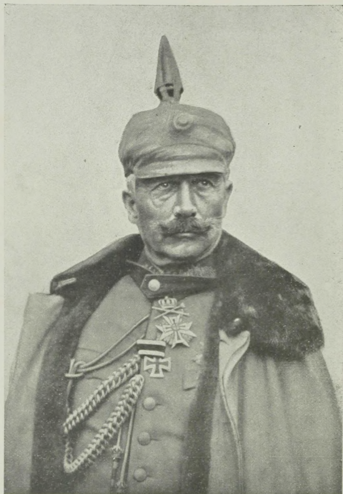
Kaiser Wilhelm II. im Felde.