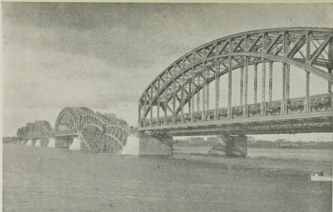
Die am 3. September 1917 von den abziehenden Russen gesprengte Dünabrücke.