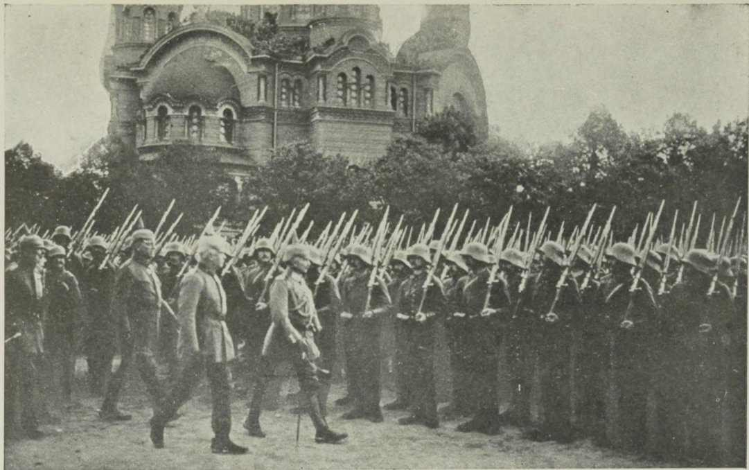
Kaiserparade auf der Esplanade zu Riga am 6. September 1917.