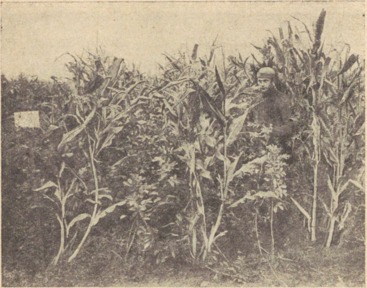
Joon. 1. Maisi hübriid «Bukoviina-3» ja põlduba «Major» külvatud üle rea.

pöörata tähelepanu üle rea külvidel õige põldoa külvinormide leidmisele, sest ei ole kindel, kas on õige külvata siin põlduba puhaskülvi normi alusel. Näiteks Kuusiku Katsabaasi katsetes andis ka ühesugune põldoa ja maisi taimede arv kõrvuti olevatel ridadel hea saagi. Et põldoa seemet on meil vähe, siis peame leidma külvinormid, kus häid tagajärgi saame võimalikult väikese seemnekuluga. Seguskülv on esialgu kõige soovitamaks põldoa ja maisi kooskasvatamise mooduseks. Siin võime külvises lisada maisiseemnele põlduba niipalju kui meil on võimalik, näiteks 10%, 20% või 30%. Edaspidistes katsetes on tarvis leida kooskülvide külvinormid ja selline põldoa ning maisi vahekord külvises, mis tagaks maksimaalse söötühikute ja proteiinisaaagi, kusjuures haljasmassi segus peaks olema vähemalt 100 g või isegi 120 g seeduvat proteiini söötühikus.