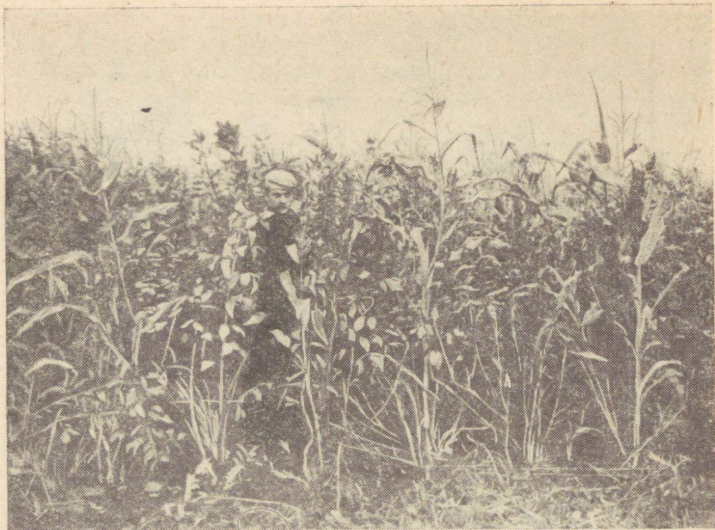
Joon. 2. Mais «Voroneži-76» ja põlduba «Major» külvatud seguna.

vatamisel kasutada liiga väikesi lämmastikväetiste koguseid, sest mais on väga suure lämmastikunõudlusega kultuur. Ka pole praegu veel teada, kui palju mais omastab põldoa mügarbakterite poolt kogutud lämmastikust.