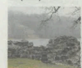
Küünlad süüdatakse nii Teisel Kirsimäel kui Viljandi järve vastaskaldal.

Parrest lisas, et kui juhitud sadama lörtsi ja kärnkonn, siis läheb keeruliseks, kuid kool on igal juhul valmis. «Proovime väga vaprad olla. Meie noortehüüb lubas kummikud jalga ja pealambid pähe panna ning minna teisele poole järve müttama. Ja et see on ikkagi kunstisündmus ja häpening, mitte orkestreeritud lavastus, jätkame pisikesel saladusel alles. Iga inimene, kes seda vaatama tuleb, saab oma panuse anda.» (Sakala)