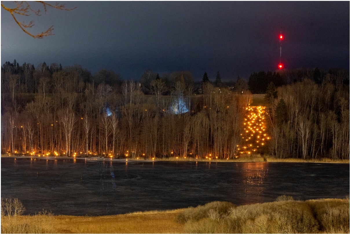
Lisa 8. Fotod sündmusest.