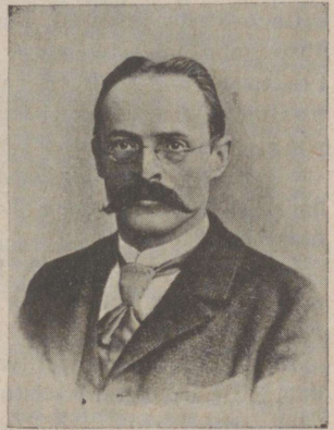
Prof. dr. Eduard Rudolf Kobert.

Kobert on lugenud enam valituid peatükke arstiteaduse-ajaloost, käsitledes mitmeid ajaloolisi perioode. Ta on ettekannud: „Geschichte der Medicin von der Römerzeit an“ (1888. I), „Geschichte der Medicin vom Untergang des Römischen Reichs ab“ (1889. II), „G. der Medicin bei den Völkern [des Alterthums“ (1892. I), „Ausgewählte Capitel aus der Geschichte der Medicin“,