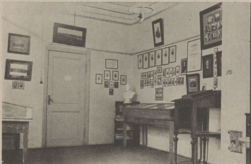
Meditsiini-ajalooline kabinèt Tartu Ülik. kohtuliku arstiteaduse instituudi juures.

Kokkuvõttes võib tähendada, et meditsiini-ajalugu Tartu Ülikooli asutamisest kuni käesoleva ajani arstiteadusliste peaainete kõrval ikka tagaplaanil on seisnud, olgugi, et ta iga arsti meditsiinilise arenemiskäigus etendab tähtsat