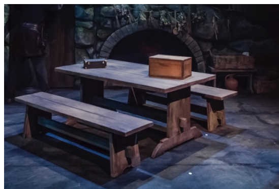
Foto 9. (Detail fotost). Vanutatud mööbel maalitud kivipõrandal. 2022.

Laval tehtavad tööd olid veel kuue projektsioonitüllil lõikamine sobivasse kujusse ja suurusesse; kanga tegemine, mis varjaks lavastuse alguses nii-öelda kaljulõhet ning mustade kangaste kinnitamine kaljuavauste taha (uksed, koopad). Projektsioonitüllid ehk gobelääntüllid olid tellitud ShowTex -i e-poest, kust oli võimalik