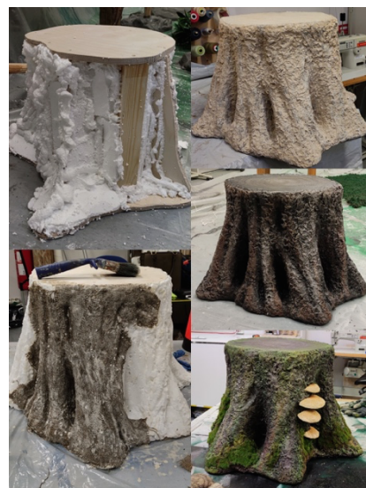
Foto 12. Kännu valmistamise etapid. 2022.

Murdunud puud ja selle puu kändu mina ei teinud, kuid nende tööprotsess oli üldiselt