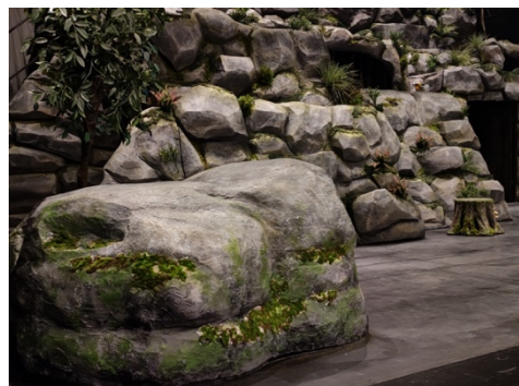
Foto 14. Eraldiseisev kivi. 2022.

Viimane liik dekoratsioone olid kaljudest eraldiseisvad kivid. Neid oli vaja teha kaks tükki: üks suurem, kuhu näitlejad saaksid peale astuda ja teine väiksem, mida oleks võimalik käes hoida. Mõlema kivid olid osaliselt taaskasutus Eesti Noorsooteatri varasemate lavastuste kividest, mida tuli nüüd lihtsalt kohandada “Röövlitütar Ronja” jaoks. Väiksema kivi jaoks ühendasid dekoratsioonimeistrid kaks kivi üheks. Kivide alla kinnitati vineerplaat ja mõlemast kivist lükati läbi puidust pulgad, mille paigalpusimine kindlustati Makroflexi montaaživahu abil. Järgnes liigse vahu eemaldamine ja kivi värvimine suurte kaljudega sarnaseks. Suure kivi jaoks kasutati samuti kivi ühest varasemast lavastusest. Sellele ehitati alla kõrgendus ning meie kleepisime kivi kangaga üle. Seejärel värvisime ja viimistlesime sammalde ja samblikega, täpselt nagu suurte kaljude puhul. (Foto 14)