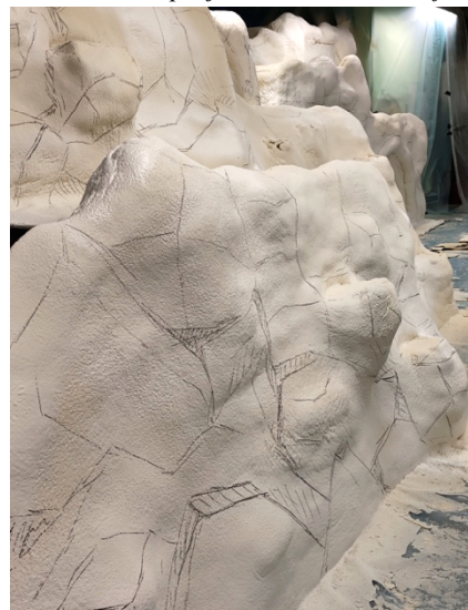
Foto 4. Kivide piirjooned. 2022.