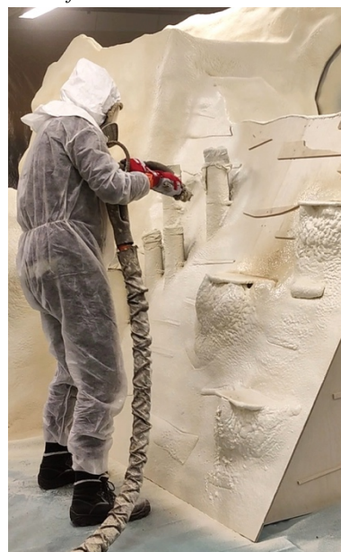
Foto 3. Kihiti vahu kasvatamine. 2022.

Vahu laskmise ajal tekkivad aurud on mürgised, mistõttu peab olema täielikus kaitseriietuses (täismask, kindad, kaitseülirikond, kinnised jalanõud), kuid pärast kivistumist on see tervisele ohutu ja lõigata on võimalik seda juba u 10 minuti möödumisel (kuigi soovitatav on siiski oodata vähemalt ööpäeva). Lõikamisel ja lihvimisel tekkiv sodi ja tolm lühiajalisel kokkupuutel enam mürgine ei ole, aga pikaajalisel sissehingamisel, palja nahaga kokkupuutel ja silma sattumisel võib siiski tervist kahjustada. Seetõttu kandsime ka meie dekoraatori ja praktikantidega kogu tööprotsessi vältel kaitseriietust, täismaski (või poolmaski ja prille), töökindaid ning vältisime vahu kokkupuudet nahaga nii palju kui võimalik. Samuti kasutasime elektriliste tööriistade tekitatud valju heli tõttu müra summutavaid kõrvaklappe.