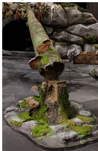
Foto 13. Murdunud puu. 2022.

sama nagu kännul, ainult butafoorsete kännuseente asemel kasutati viimistlusena päris puuseeni. (Foto 13) Puu jaoks tegid dekoratsioonimeistrid torukujulise vineerkarkassi, mis kinnitus hingede abil kännu külge ning puu alumisele ja kännu ülemisele osale oli lõigatud omavahel kokkusobituv murdumiskoht, et laval oleks võimalik tekitada puu murdumise efekti. Puu vineeripind ja känd said kaetud täpselt samamoodi nagu eraldiseisev känd – esialgu kotiriide ning seejärel tekstuurse Foamcoat -saepurumassiga. Pärast katmist ja kuivamist lihviti üleliigne maha, värviti ja viimistleti.