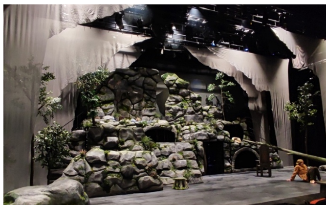
Foto 11. Toonitud tüllid laval. 2022.

Üheks viimaseks tööks laval oli tegelemine kangaga, mis pidi lavastuse alguses varjama nn kaljulõhet (avaus kahe dekoratsioonipoole vahel). Kangas tuli lõigata veidi laiemaks kui avaus, mida see katma pidi, et see