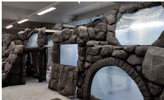
Foto 6. Foamcoat-iga kaetud ja lihvitud pind. 2022.