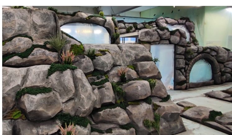
Foto 7. Värvitud pind sammalde ja taimedega. 2022.

kordasime sama protsessi uuesti, et värvi intensiivsust suurendada. Kui kunstnik oli pinnad uuesti üle vaadanud, soovis ta hallidele toonidele veidi rohkem elu sisse tuua. Selleks lahendasime erksamat pruuni värvi veidi veega ja kandsime pintslite abil valikuliselt kividele. (Foto 7)