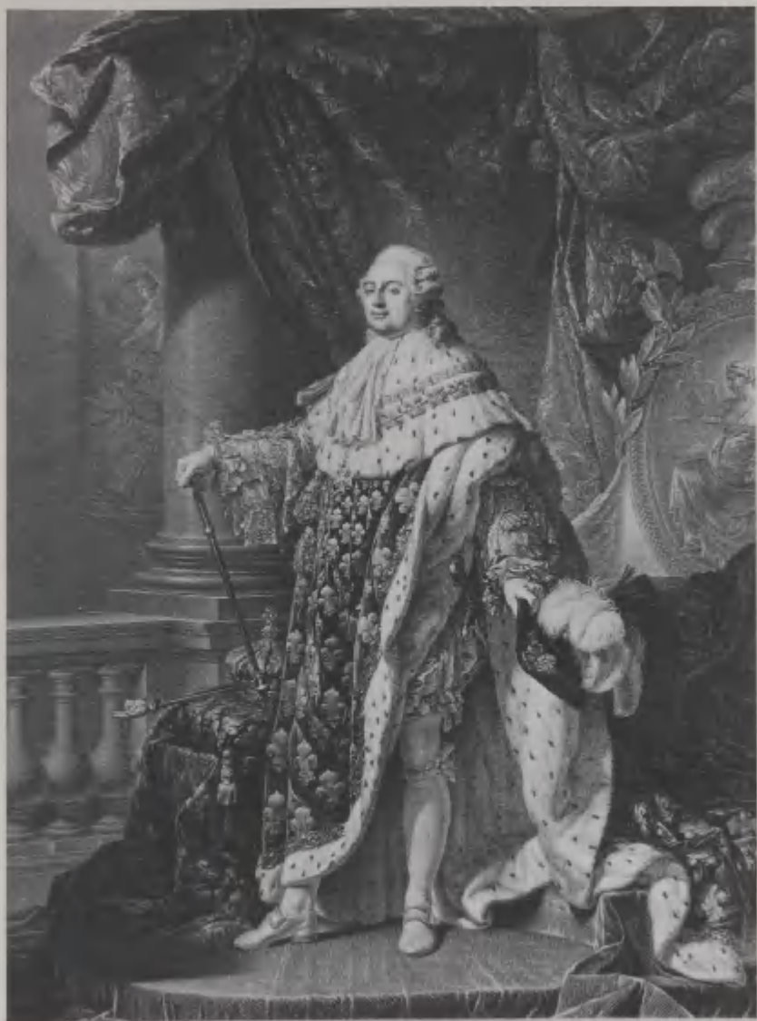
LOUIS SEIZE ROI DES FRANÇAIS, RESTAURATEUR DE LA LIBERTÉ. D'APRÈS UN TABLEAU DE M. DE LAUNAY, DÉPOSÉ À LA BIBLIOTHÈQUE NATIONALE.