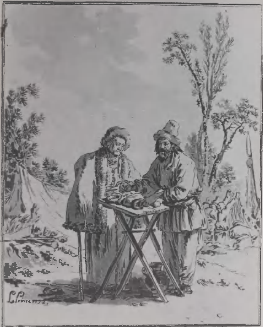
Le Marchand de Cateaux