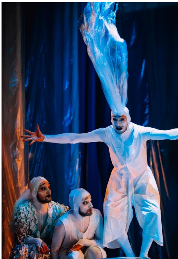
Pilt 3. Tuultest rääkimine