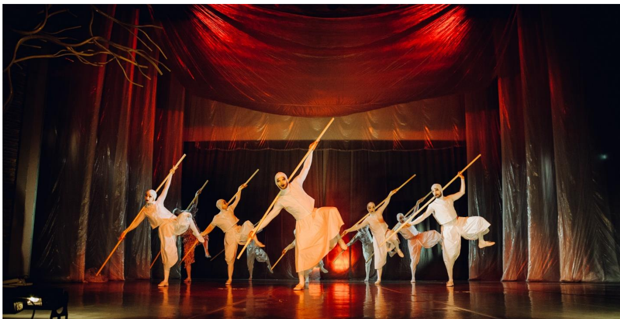
Pilt 6. Siili surma tants