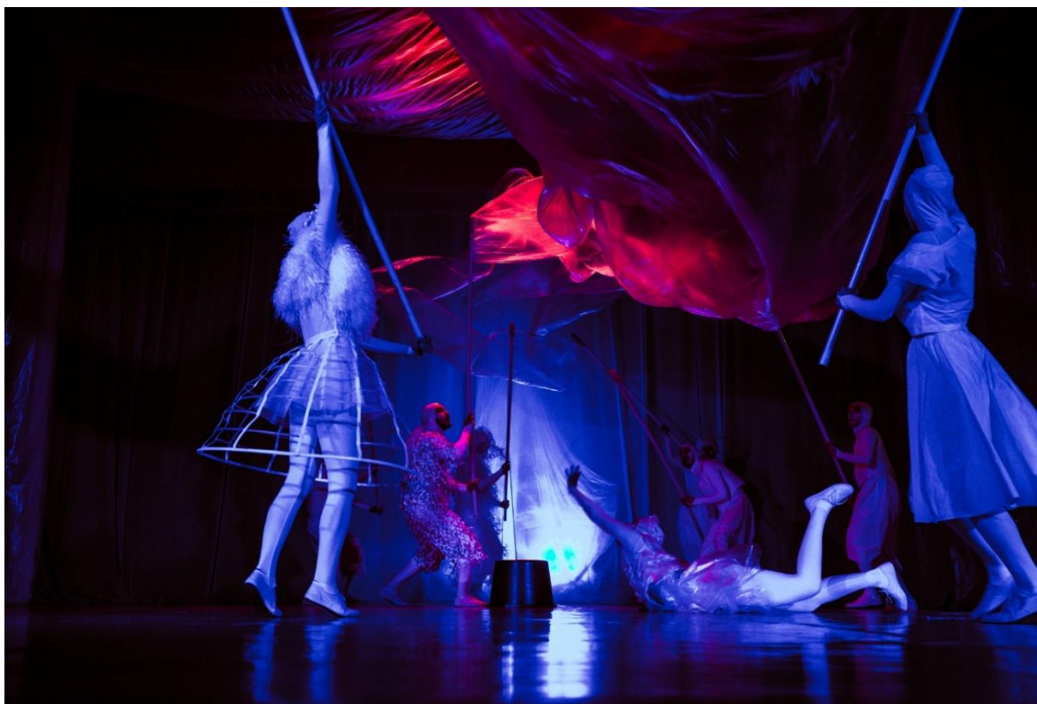
Pilt 2. Suure hundi sisenemine