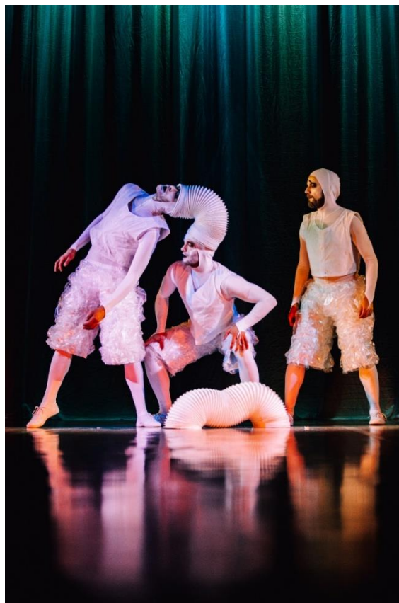
Pilt 5. Kastraadid