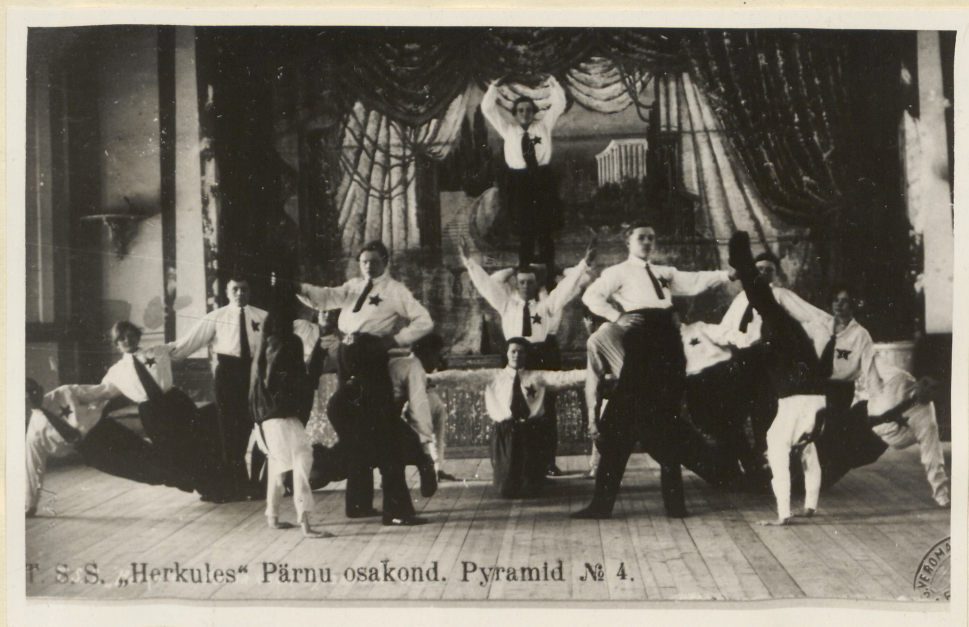
Töölissporðiseltsi "Herkules" Pärnu osakonna sportlased esitamas püramiide.