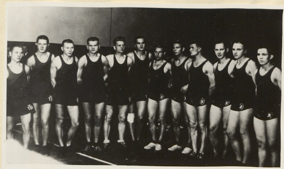
Tallinna Töölisspordi Ühingu ja töölisspordiühingu "Rünnak" poksijad.

üldise tunnustuse osaliseks ja siitpeale kujunesid naisvõimlejate külaskäigud Soome töölissportlaste juurde traditsioonilisteks. 1)