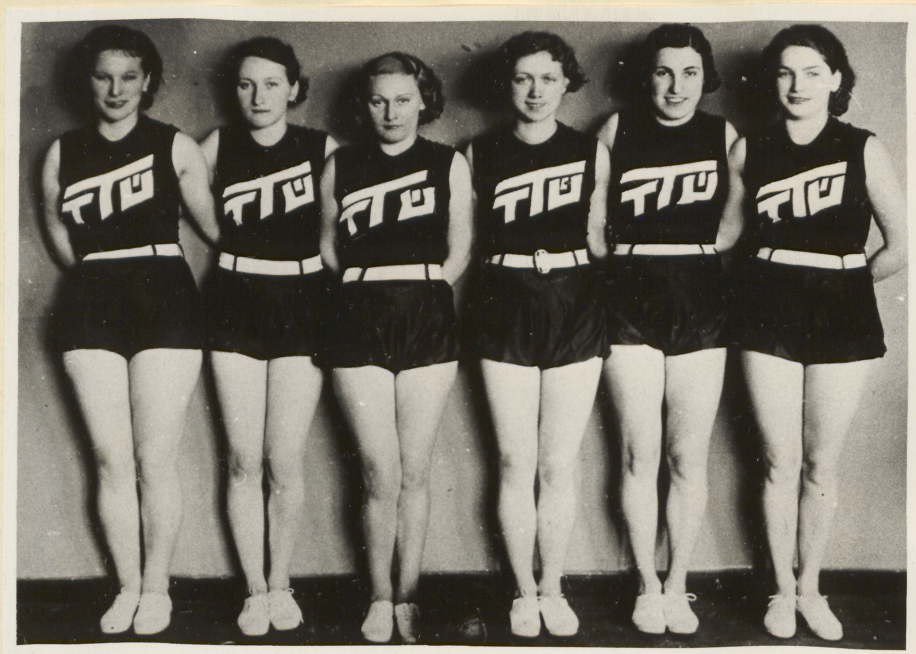
Tallinna Töölisspordi Ühingu võrkpallinaiskond.