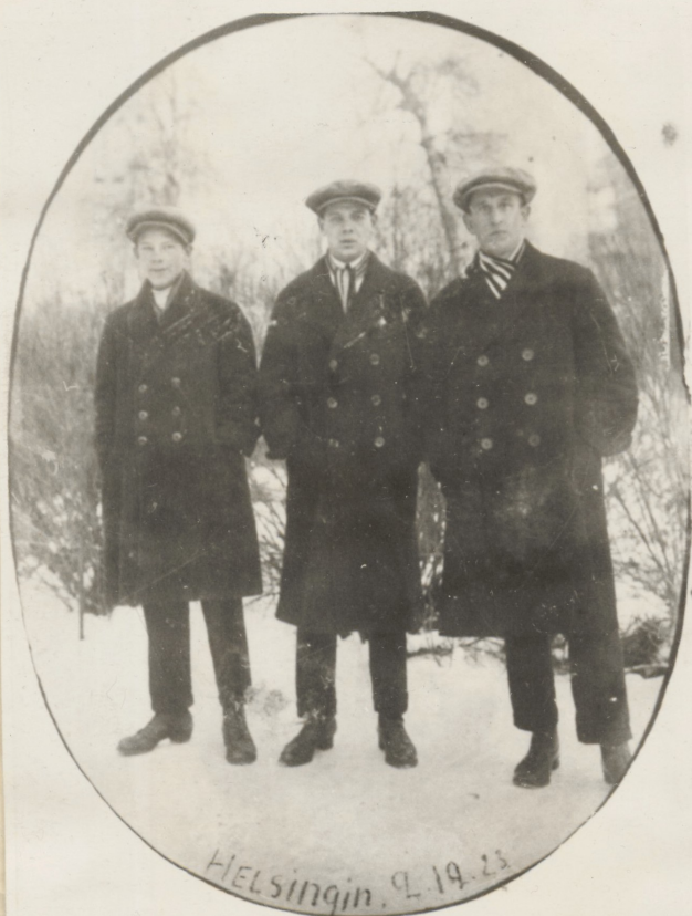
Tallinna töölis- sportlased-poksijad Helsingis