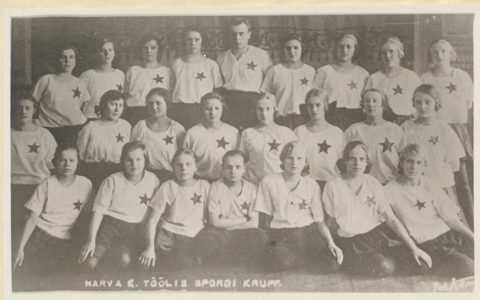
Narva Kreenholmi töölissportlasi.

laste ühingu registreerimiseks. "Üle-eestimaaline Noorproletaarlaste Ühing", öeldi põhikirja 2. paragrahvis, "peab oma eesmärgiks ühendada kõiki noor-