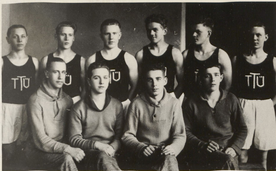
Tallinna Töölisspordi Ühingu korvpallimeeskond.

kui staadionile jõudes leidsime selle pealtvaatajatest täidetuna. Vihma sadas otsakuil oavarrest, kuid 6000 - 7000 pealtvaatajat ei lahkunud vist ainsatki... Püsida kestva saju all kohal poolteist tundi, mängu lõpuni. See oli sportliku huvi ülim tipp..." 1) See oli ühtlasi ka huvi ja lugupidamise väljendus külalatuinud töölisspordivõistkondade vastu.