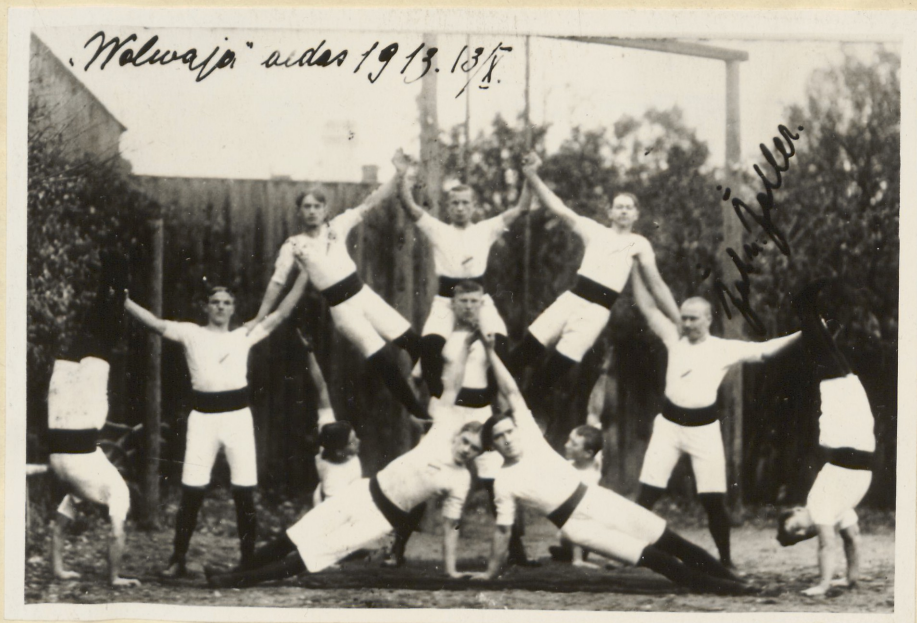
Karskusseltsi "Valvaja" spordiosakonna võimlejad "Valvaja" aias 1913.a.