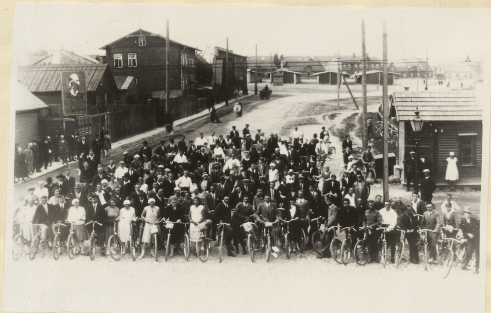
Töölissportlaste väljasõit maale.

Samuti ka "Valvaja", Metall- ja Puutöölise Ühisuste ja Ehitustöölise Liidu spordiosakonnad... Kui Pelgulinna või Magasini tänava noored töölised üksikult tegutsevad, puuduvad neil võimalused treeninguteks jne. Spordiseltis tegutsedes moodustavad nad aga tugeva organisatsiooni, mille ees isegi töörahva kurajad hirmu tunnevad. 1)