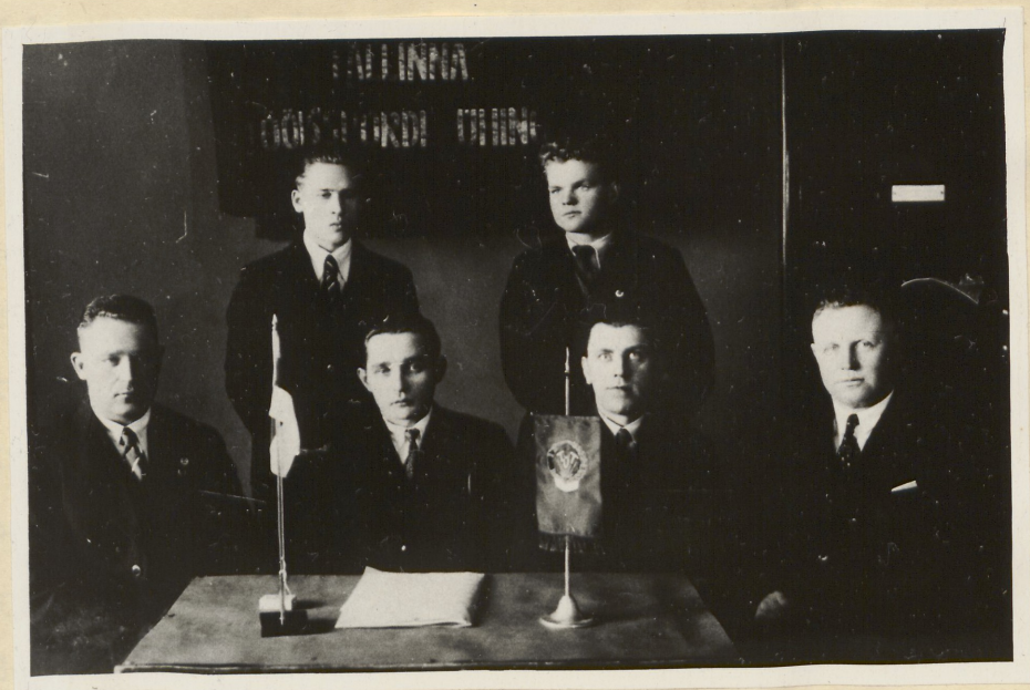
Tallinna Töölisspordi Ühingu juhatus.

enamiku meelsus kaugeltki reformistlik. Hiljem oli sotside partei juhtkonnal küllaltki peamurdmist, et suunata spordiliikumistest osavõtivate noorte tegevust, kes sugugi ei saanud rahunud olla kentiva ebaaiglase uniskonnakorraga, endile vastuvõetavatesse rööbastesse. Töölisspordiühingute poolt, sinna kogunenud kommunistide ja kommunistlike noorte suunamisel, väljakuulutatud radikaalsed seisukohad olidki selleks teguriks, mis muutis need ummikust väljapääsu otsivate noorte koondumiskohtadeks.