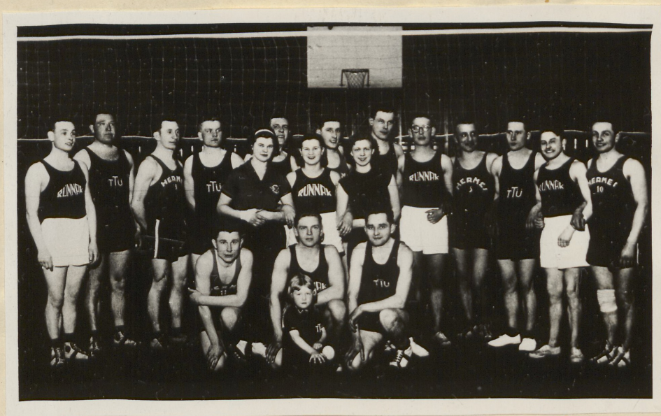
Töölisspordiühingute "Rünnak", "Hermes" ja TTÜ (Tallinna Töölisspordi Ühing) võrkpallimängijad.

1937.aastaks oli ETL-i eksisteerimise aja jook- sul liidust läbi käinud ja siin sportliku karastuse saanud umbes 7600 liiget ja osakondi olnud umbes viiekümne ümber. Vahepeal olid mitmedki liikmeid, kes olid läinud üle kodanlikesse spordiseltsidesse ja esines isegi juhtumeid, kus terved meeskonnad läksid üle kodanlikku spordiliitu nagu näiteks Kopli Sparta jalgpallimeeskond, Tasuja meeskond, Sindi Lodja Ühing jt. 1) 1937.aastal kuulus Eesti Töölisspordi Liitu 20 osakonda. Nii tegutsesid Tallinnas ETL-i osakonnad: Tallinna Töölisspordi Ühing (TTÜ), "Hermes", "Rünnak",