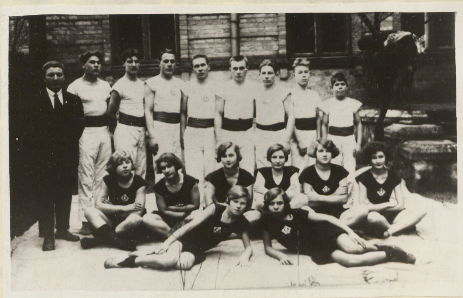
Karskusseltsi "Valvaja" spordi- osakonna liikmeid Töölise Maja juures, Vaksali pst. 8 1928.a.

Samasugune spordipublik oli kõikjal. Järgmisel aastal toimus Moskva lähedases tööstuslinnas Gluhovos, kus tol ajal oli vaid 60000 elanikku, samuti eesti töölissportlaste kohtumine jalgpallis kohaliku koondusega. Ka siin nägid eesti töölissportlased enneolematut spordivaimustust. "Sadad pööraselt vihma. Köva sadu oli alanud juba hommikul ja