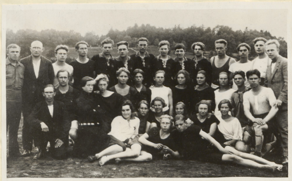
"Spartakuse" kergejõustikuvõistlustest osavõtjad 12.augustil 1923.a.

taseme tõstmiseks: "... kehakultuuri arendamisega peame edasi jõudma ka vaimse tasapinna tõstmiseks. Töölisspordiseltsid peavad oma kultuurharidusliku töö kooskõlastama teiste töölisorganisatsioonide kultuurharidusliku tööga." 1) )