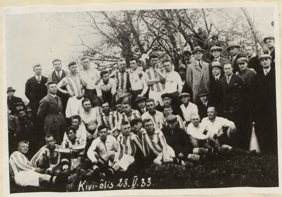
Kiviõli kaevurite jalgpallimeeskond enne võistlust 1933.a.

Selleks ajaks kui toimusid need võistlusreisid oli Eesti Töölisspordi Liit oma tegevuses teinud mitmeidki edusamme. Varsti pärast ETL-i asutamist tekkisid ühingud Rakverre, Viljandisse, Viitnale, Tallinnasse uusi ühinguid jne. Poole aasta jooksul kasvas ETL-i kuuluvate organisatsioonide arv enam kui kahekordseks. Hakati harrastama võimlemist, sportmänge, poksi, kergejõustikku, jalgpalli jm. Kui 1927.a. sügisel kuulus ETL-i 4 ühingut umbes 300 liikmega, siis 1928.a. lõpuks oli see arv suurenenud juba 18 ühinguks ja liikmete arv 1270-ni. Suurim ETL-i kuuluva test ühingutest oli Tallinna Töölisspordi Ühing, mis oli ühe aastaga kasvanud 61 liikmelisest kuni ligi 300 liikmeni. 1)