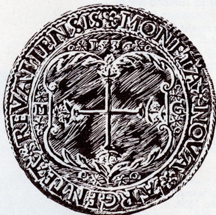
1536. a. Tallinnas münditud hõbetaaler (Vana Tallinn I).

VANA TALLINNA köited muutuvad ajajooksul selleks varasalveks, kust asjasthuvitatud võivad ammutada mitmekülgseid teatmeid Tallinna ajaloo, kultuur- ja kunstiajalooliste küsimuste kohta. Ta on väärtuslikuks ning kauniks ehteks igale eesti kodule ja raamatukogule.