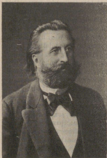
Prof. dr. Ernst von Bergmann nooremas eas.

Bergmann'i loengutel oli kliiniku auditoorium ikka tungil täis. Ta ise oskas oma kuulajate tähelepanu köita ja äratada huvi kirurgia vastu. Oma õpilasi ei unustanud ta. Iseloomustavad on ta sõnad, öeldud ühele endisele Tartu õpilasele, kes teda hiljem külastas Berliinis hetkel, kui Bergmann oma käsi pesi enne suuremat lõikust: „Es geht jetzt etwas anders her, als