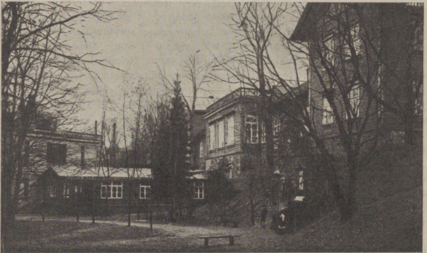
Tartu Ülikooli teaduskonna-haavakliinik umbes 25. aasta eest.