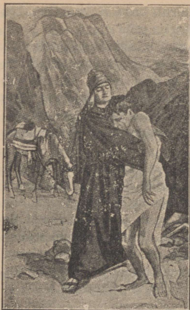
Halastaja Samaria mees.

päeval edasi matkas, andis ta peremehele kaks rahatükki ja ütles: „Kanna hoolt tema eest! Ja mis sa veel peaksid kulutama, selle tasun sulle tagasi tulles!“ Nüüd ütles Jeesus käsutundjale: „Keda pead sa neist kolmest selle ligimeseks, kes oli sattunud röövlite kätte?“ Käsutundja vastas: „Seda, kes tema peale halastas.“ — „Mine ja tee nõndasamuti,“ käskis teda Jeesus.