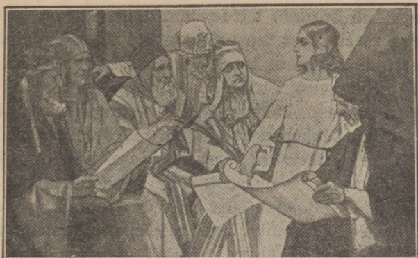
Kaheteistkümne-aastane Jeesus templis.

miks sa meile nõnda oled teinud? Vaata, su isa ja mina oleme sind õieti vaevaga otsinud.“ Jeesus kostis: „Mis see on, et teie mind olete otsinud? Eks teie ei teadnud, et ma ses pean olema, mis mu Isa päralt on! “ Nad ei mõistnud aga tema sõnu. Siis läks Jeesus tagasi Naatsaretti ja kuulis vanemate sõna. Ta kasvas tarkuses, pikkuses ja armus Jumala ja inimeste juures.