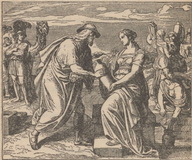
Elieeser kohtab Rebekat.

Veel enne kui Elieeser palvetamise lõpetas, ilmus kaevu juurde Rebeka. See oli ilus ja noor tütarlaps. Ta kandis õlal astjat, laskis selle kaevu ja täitis kruusi veega. Elieeser tõttas Rebekale vastu ja ütles: „Anna mulle pisut vett rüübata!“ Tütarlaps vastas: „Joo, isand, ma joodan ka su kaaba!“