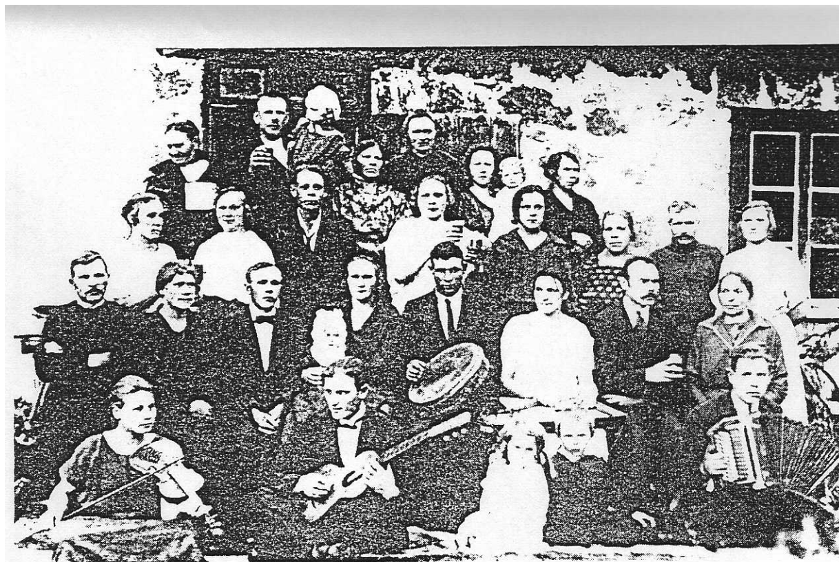
Pillimehed ja -naised(!) varrupeol Leisis Saaremaal, 1924. a. TMM-i fotokogu, nr. 56591-R.