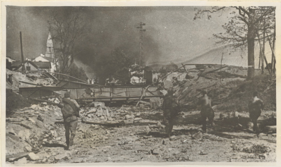
lahingud Tartu vabastamisel.

tud sündmuste täpsemat käsitlemist. Filmipaljas "Tartu vabastamine" 1 on jäädvustatud Võru vabastamine 13. aug. 1944.a. ja Tartu vabastamine 25. aug. 1944.a. Endist roheluserikast Tartu linna on raske ära tunda.