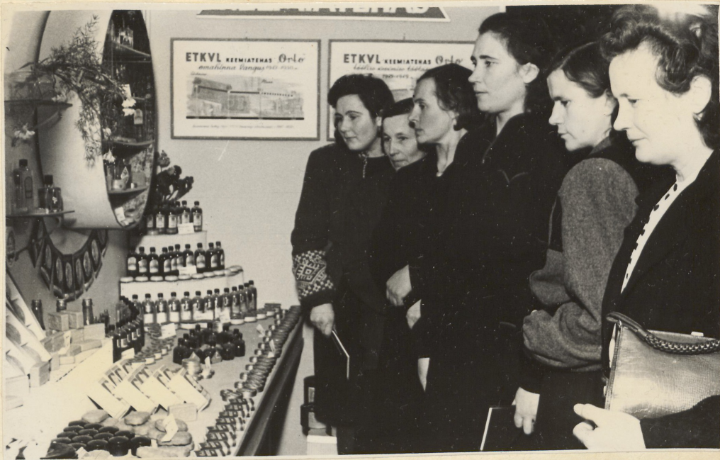
Eesti NSV naiskolhoosnike I konverents, Valgamaa delegaadid näitusega tutvumas.

Nagu mainitud, on kalurite elu käsitlevaid filmipalu ajavahemikust 1946-1950. a. kaunis napilt. Filmikaadrid paladest "Kalurite juures" ja "Eesrindlikud kalurid" 1) jutustavad kalurikolhoosi "Jahta" tööst. 1950. a. ringvaate "Nõukogude Eesti" eriväljaanne "Nõukogude Eesti kalurid" 2) jutustab Saaremaa kalurikolhoosi Põhjaranniku kaluritest.