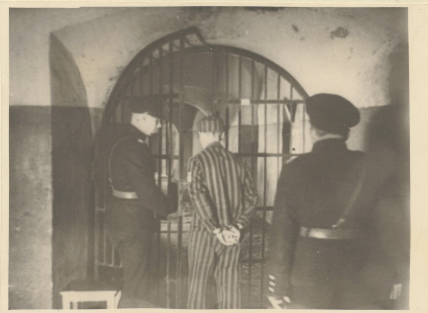
Töölise paigutamine Keskvanglasse.