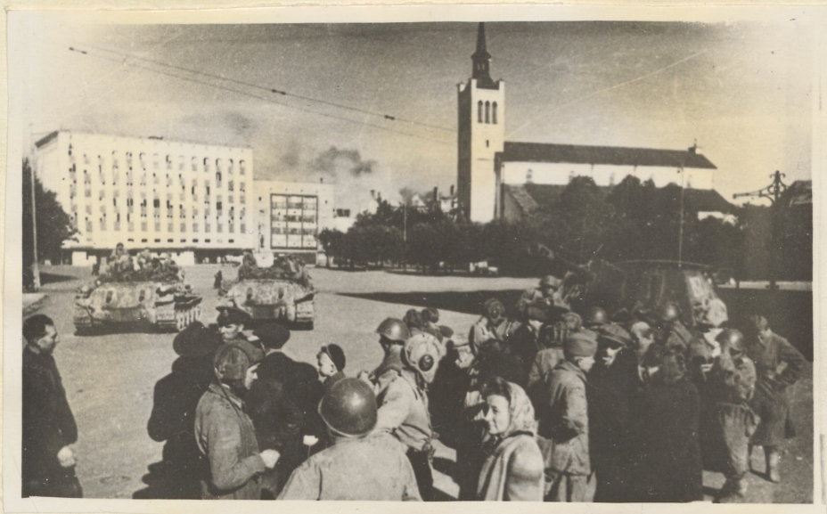
Tallinna elanikud tervitamas vabastajaid 22. sept. 1944.a.

Ka siin tervitavad elanikud südamliselt oma vabastajaid. Eesti NSV mandriosa on vabastatud. Saarte vabastamisest on säilinud mõned filmikaadrid, mis on samuti tummad ning millel puuduvad subtiitrid. Filmipala "Võitlus Nõukogude Eesti vabastamiseks", 1 võttes on öised. Vaenlane oli valmistunud saartel visaks vastupanuks ning püüdis kõigi võimalustega takistada väina ületamist meie vägede poolt ja maabumist saartele. Näeme üksteise järel lahkumas kai äärest Eesti Laskurkorpuse võitlejatega täiskiilutud paate. Valmistutakse Muhu dessandiks 1944.a. septembri lõpul. Unes paadi ninad seisab kinooperaator, kes pöörab tähelepanu kuulide vihinale, fil-