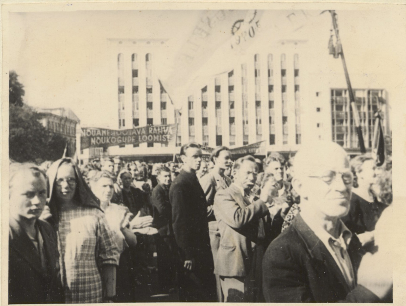
21. juuni demonstratsioon Võidu väljakul

Filmis on peatunud Eestimaa Kommunistliku Partei 1940. a. aprillikonverentsil, 20. juuni vabrikute ja töölisorganisatsioonide esindajate koosolekul Tallinna Töölisvõimlas. Palju kaadreid on 21. juuni revolutsioonilisest väljaastumisest Tallinnas.