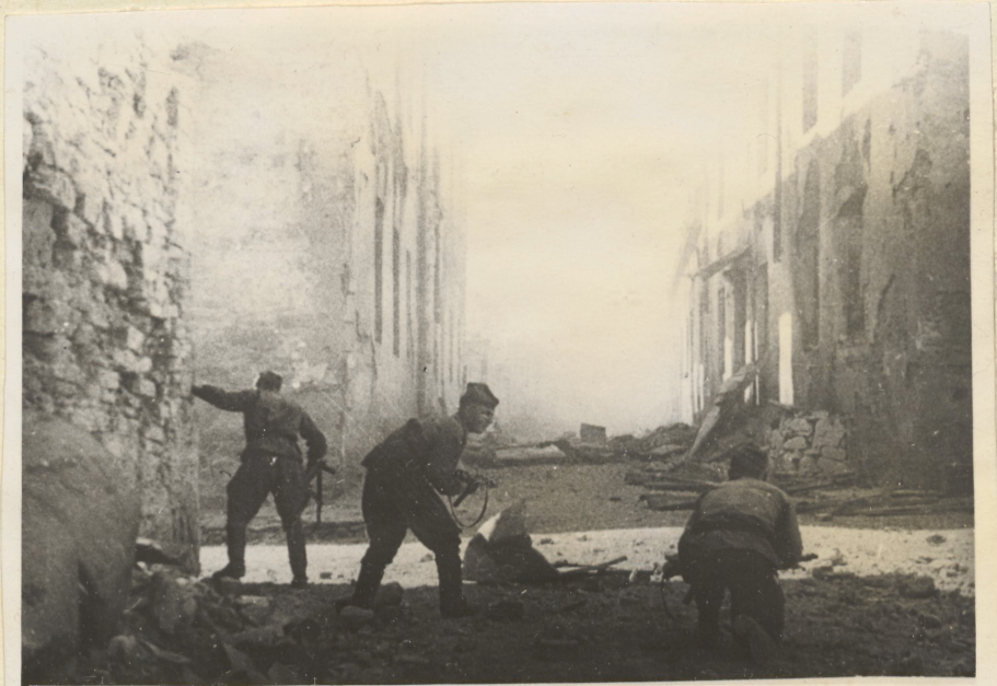
Erimesed linnajad Narva tänavail.