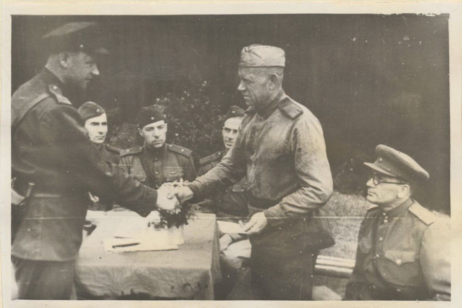
Parteipiletite kätteandmine Eesti Korpuse sõduritele.

datud eesti võitlejate pingelist lahingutreeningut täiendades oma praktilisi oskusi lahingupidamise alal. Võitlejad juhinduvas Suvorovi põhilausest "Mida raskem õppusel, seda kergem lahingus". Samas näeme ka Eesti Korpuse võitlejaid täiendamas oma poliitilisi teadmisi ning parteipiletite kätteandmist sõduritele.