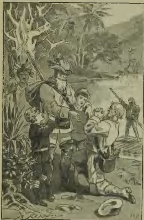
(Aus dem 1. Bändchen.)

Spillmann, Aus fernen Landen. Verkleinerte Illustrationsproben.