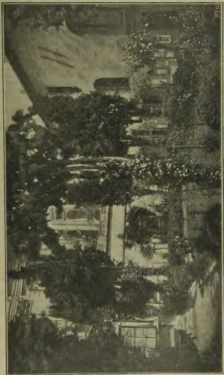
Probe der Illustration aus de Waal, Der Campo Santo der Deutschen zu Rom: Friedhof.

Waal, Anton de, Der Campo Santo der Deutschen zu Rom. Geschichte der nationalen Stiftung, zum elfhundertjährigen Jubiläum ihrer Gründung durch Karl den Grossen. Mit vier Abbildungen. 8°. (XII u. 324 S.) 4.—; geb. in Leinw. mit Deckenpressung 5.20.