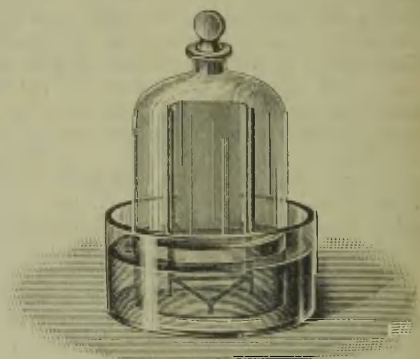
Probe der Illustration aus Rosenfeld, Elementarunterricht in der Chemie. (Fig. 2.)