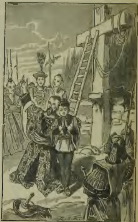
(Aus dem 5. Bändchen.)