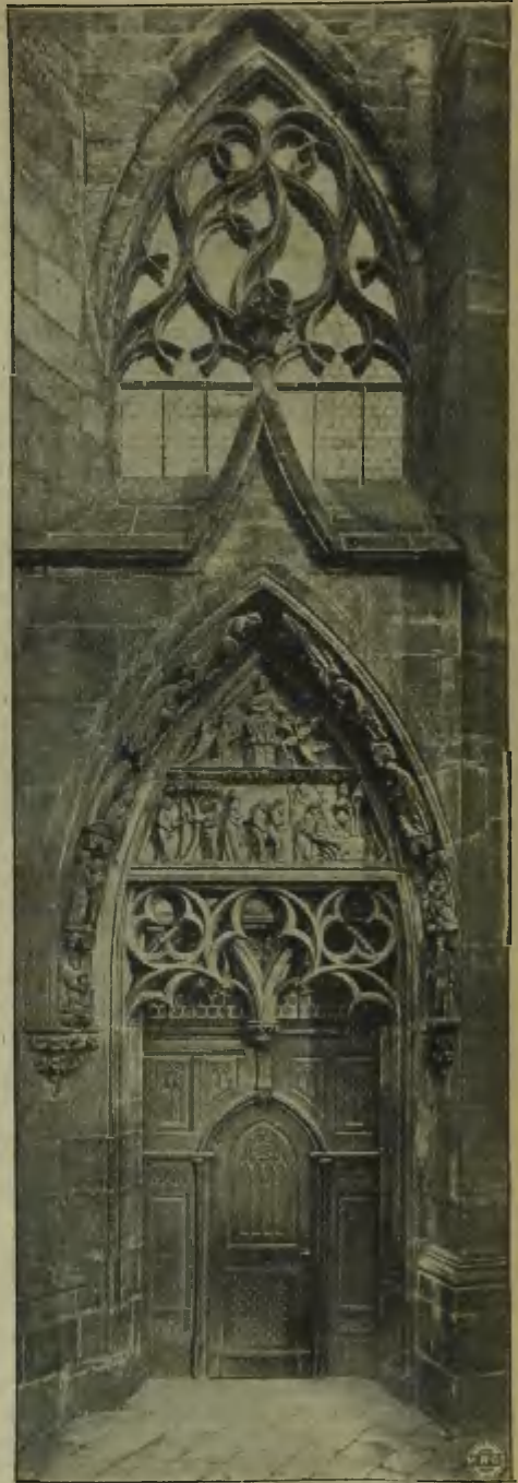
Verkleinerte Probe der Illustration aus „Unser Lieben Frauen Münster zu Freiburg im Breisgau“. (Nordportal des Chores.)

(Archiv für christliche Kunst. Stuttgart 1897. Nr. 1)