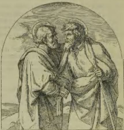
Probe der Illustration aus Detzel, Christliche Ikonographie, II. Band: Ed. von Steinle, Abschied der Apostel Petrus und Paulus. (Fig. 51.)

„Mit Freuden werden alle Freunde und Förderer der christlichen Kunst dieses Werk begrüßen, das mit der unlängst erfolgten Herausgabe des II. Bandes seinen Abschluss gefunden hat. Schon längst war ein solches Werk eine dringende Nothwendigkeit; denn wohl kaum ein Zweig der christlichen Archäologie war seit einigen Jahrzehnten bei uns so ohne alle Pflege, als die Ikonographie. Die bisher erschienenen Bücher auf diesem Gebiete der Kunstwissenschaft erwiesen sich als unzureichend, indem sowohl ihre Anlage als besonders ihr Umfang als vielfach unvollständig, unpraktisch und durch Annahme mancher falschen Grundsätze als unzuverlässig erschienen. Es musste daher der Wunsch aller Freunde des christlichen Alterthums und der Kunstgeschichte sein: die energische Wiederaufnahme, Hebung und Vervollkommnung der diesbezüglichen Studien durch ein neues, gründliches, zuverlässiges Werk gefördert zu sehen. Diesen Wunsch hat Detzel in seiner Ikonographie erfüllt. . . .“