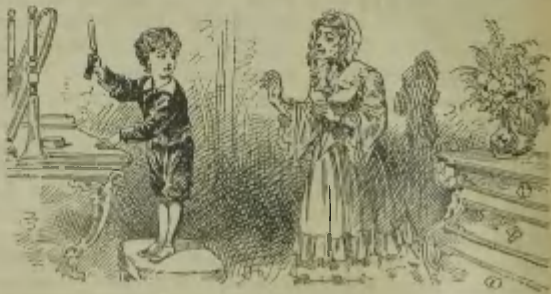
Probe der Illustration aus Fleuriot, Ein verzogenes Kind. (S. 1)

Séjour, Gräfin von (geb. Rostopchine), Die Herberge zum Schutzengel. Aus dem Französischen übers. von Elise von Pongrácz. Zweite Auflage. Mit 67 Illustrat. (VIII u. 280 S.) 1.80; geb. 2.—