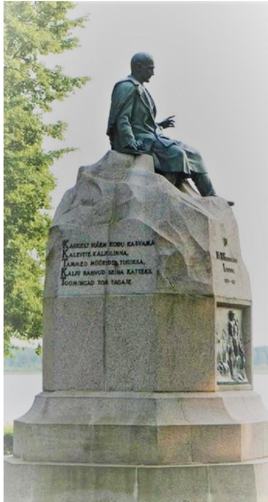
Lauluisa monument Võrus

„Kiirest kaovad meie päevad, Tuhatnelja elu tunnid ...“