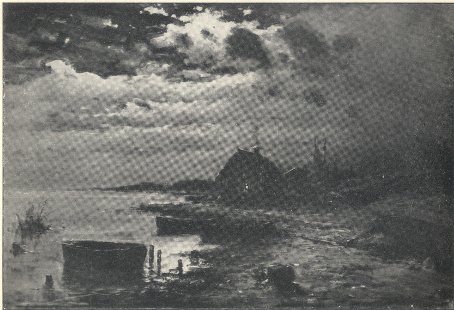
Nacht an der Aa bei Riga