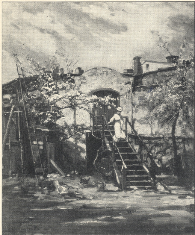
Der Weg zu Großmama's Garten