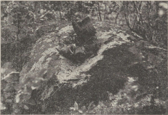
R. Viidalepa foto 1936.

Muinaseestlase usu järgi surnute hingejõudu võis siirduda ka matmispaiga puisse, kividesse jne., mis said seega maagilist väge ja võisid muu seas ka arstida, parandada haigusi. Et neilt abi saada, viidi ohvrit. — Eestis näib pühade kivide, allikate ja puude kultus olevat kõige paremini säilinud Läänemaal, osalt kuni meie päevini (vt. 58. joonist). Tuntakse siin haruldaselt palju hiie-, ohvri-, maaaluste-, viske- ja nõiakive, millele on viidud ohvriks soola, raha, leiva-