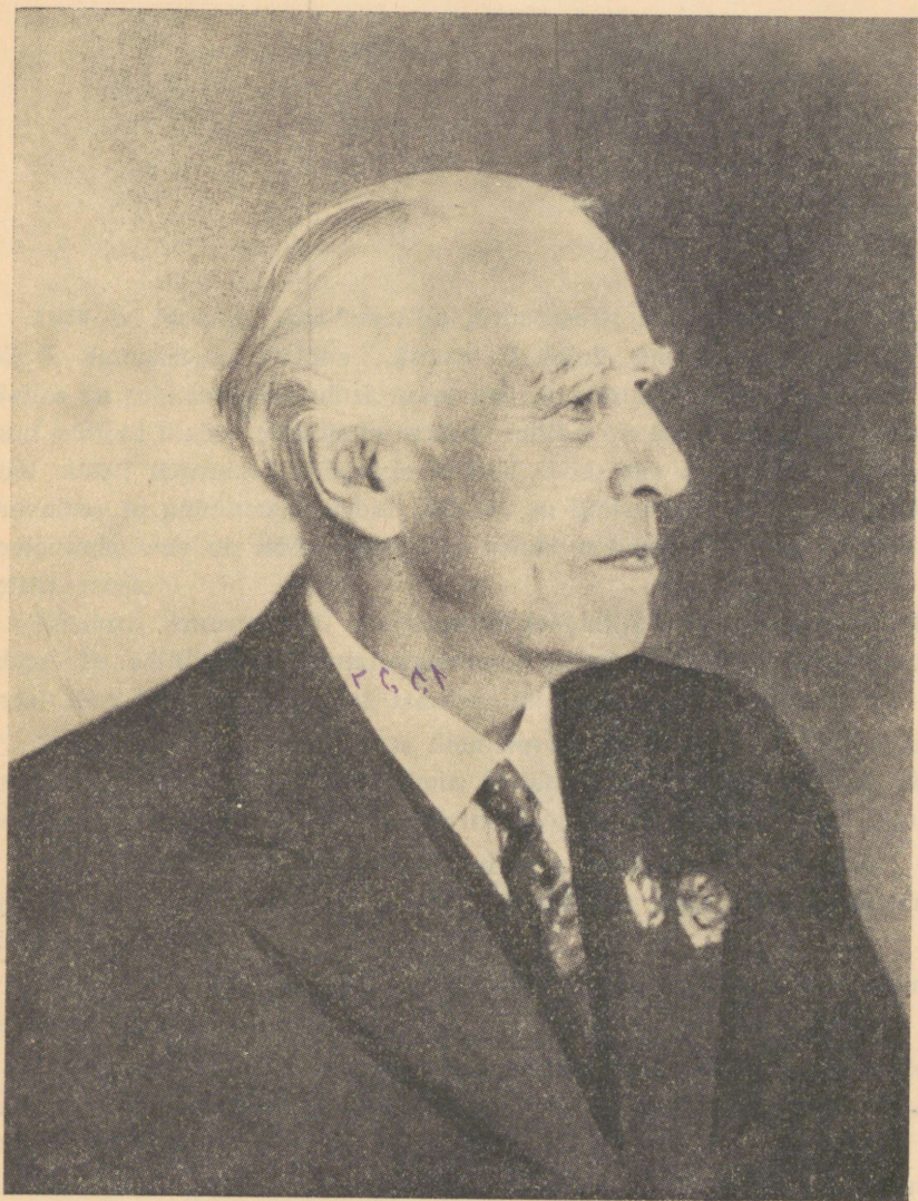
K. S. STANISLAVSKI